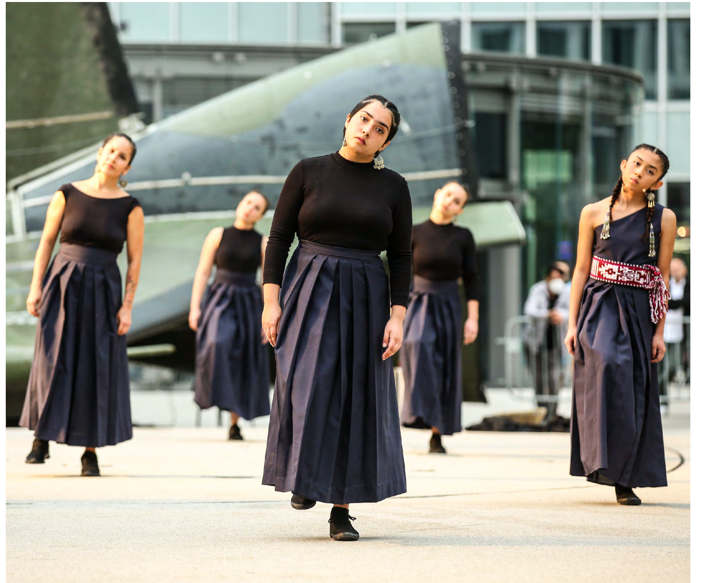
Theater del Welt, Alemania (2021).