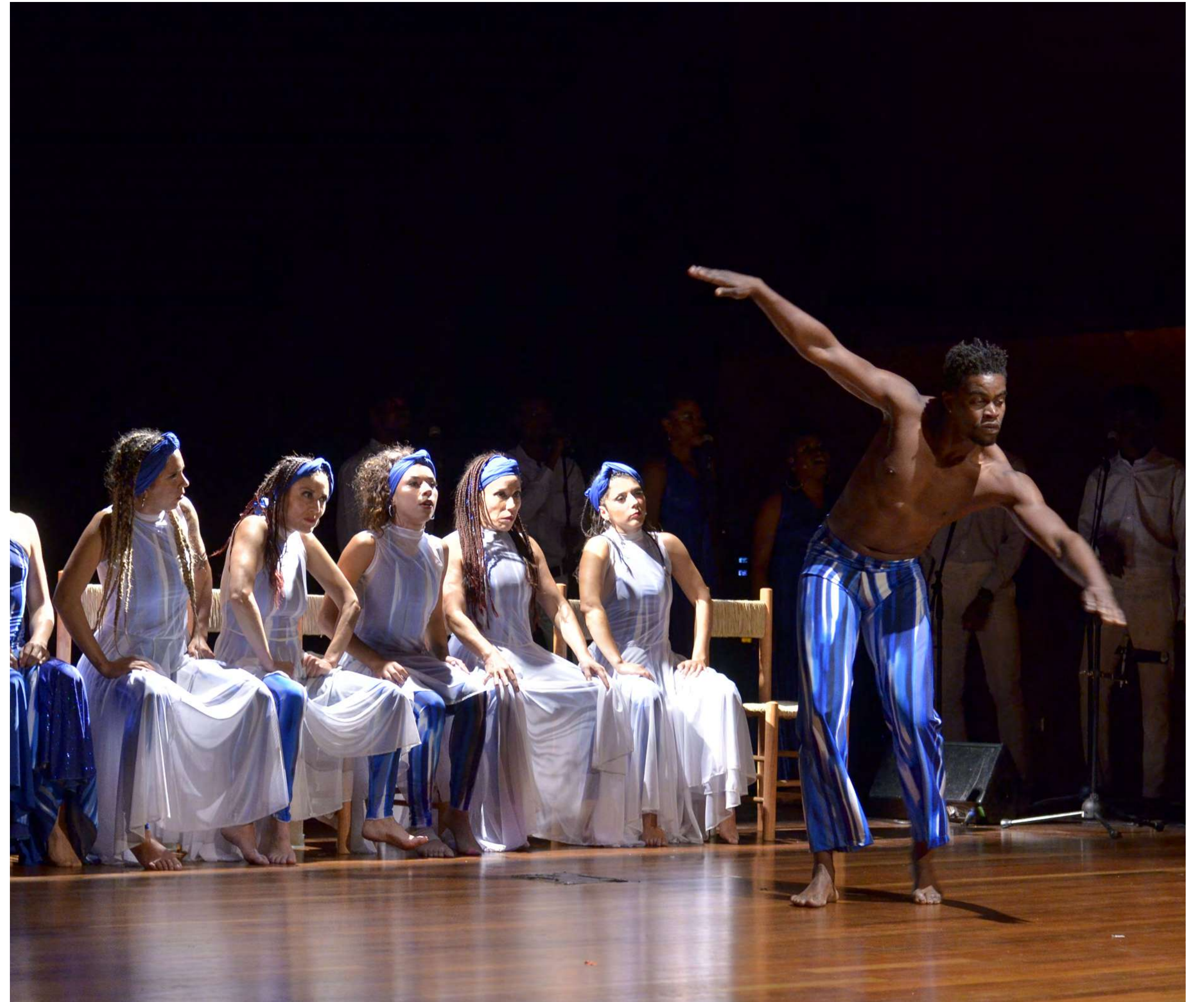
GAM (2020).