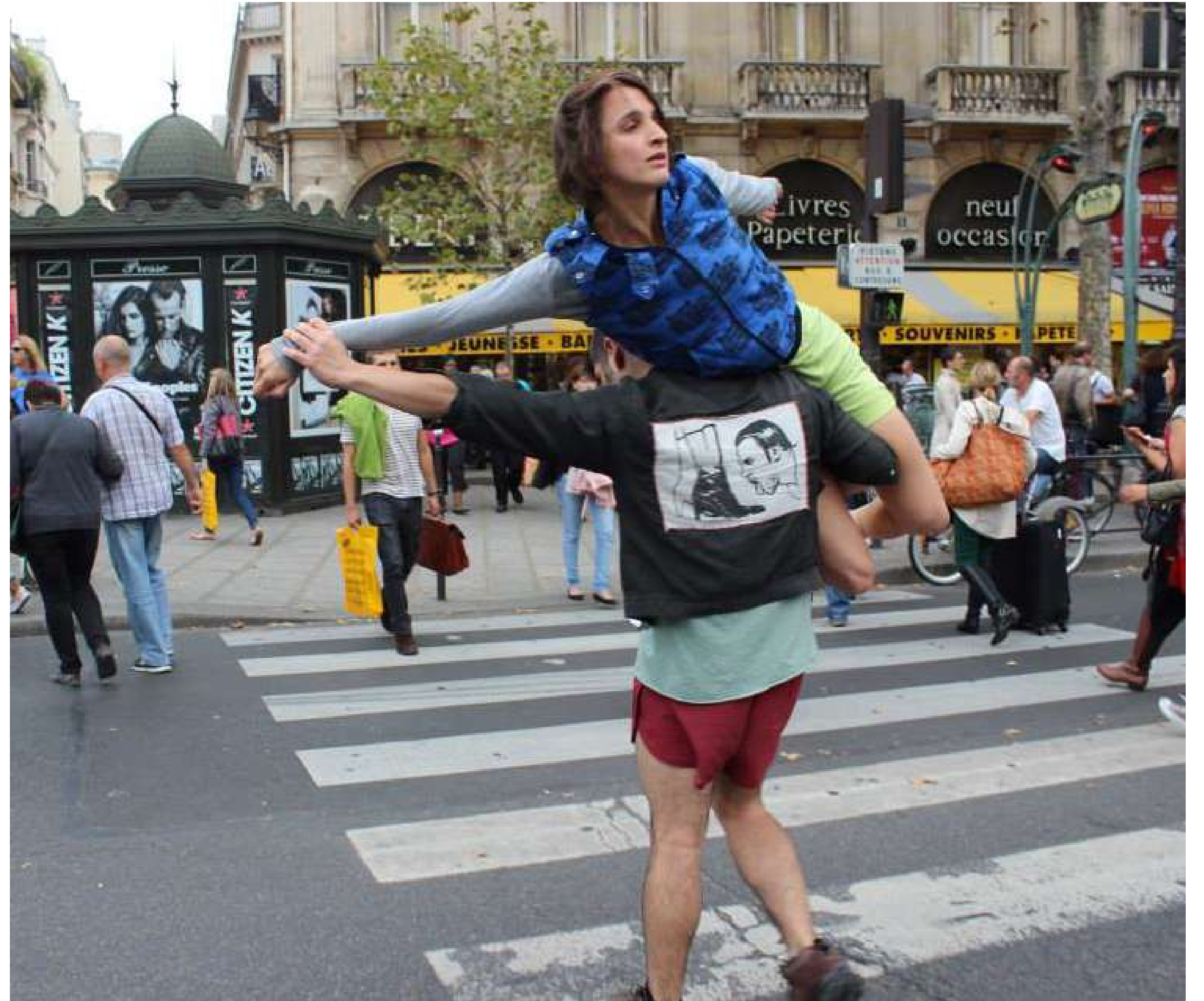
Santiago (2019).