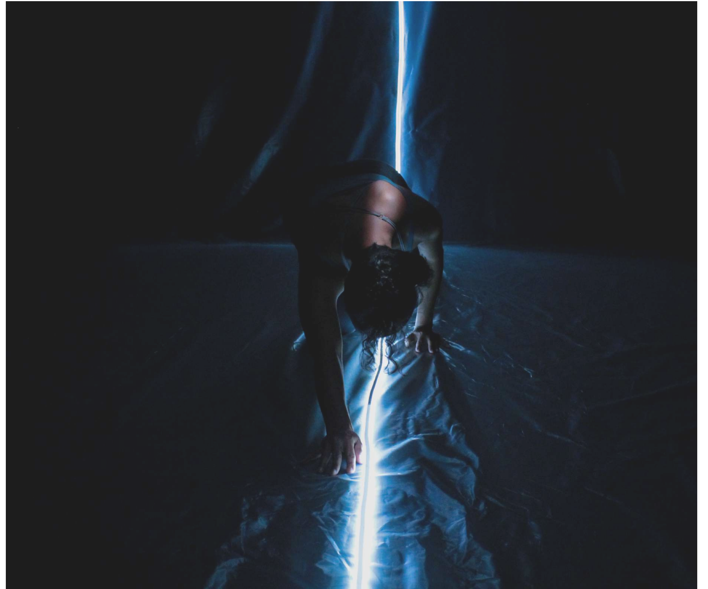
NAVE (2019). ©Pablo López.