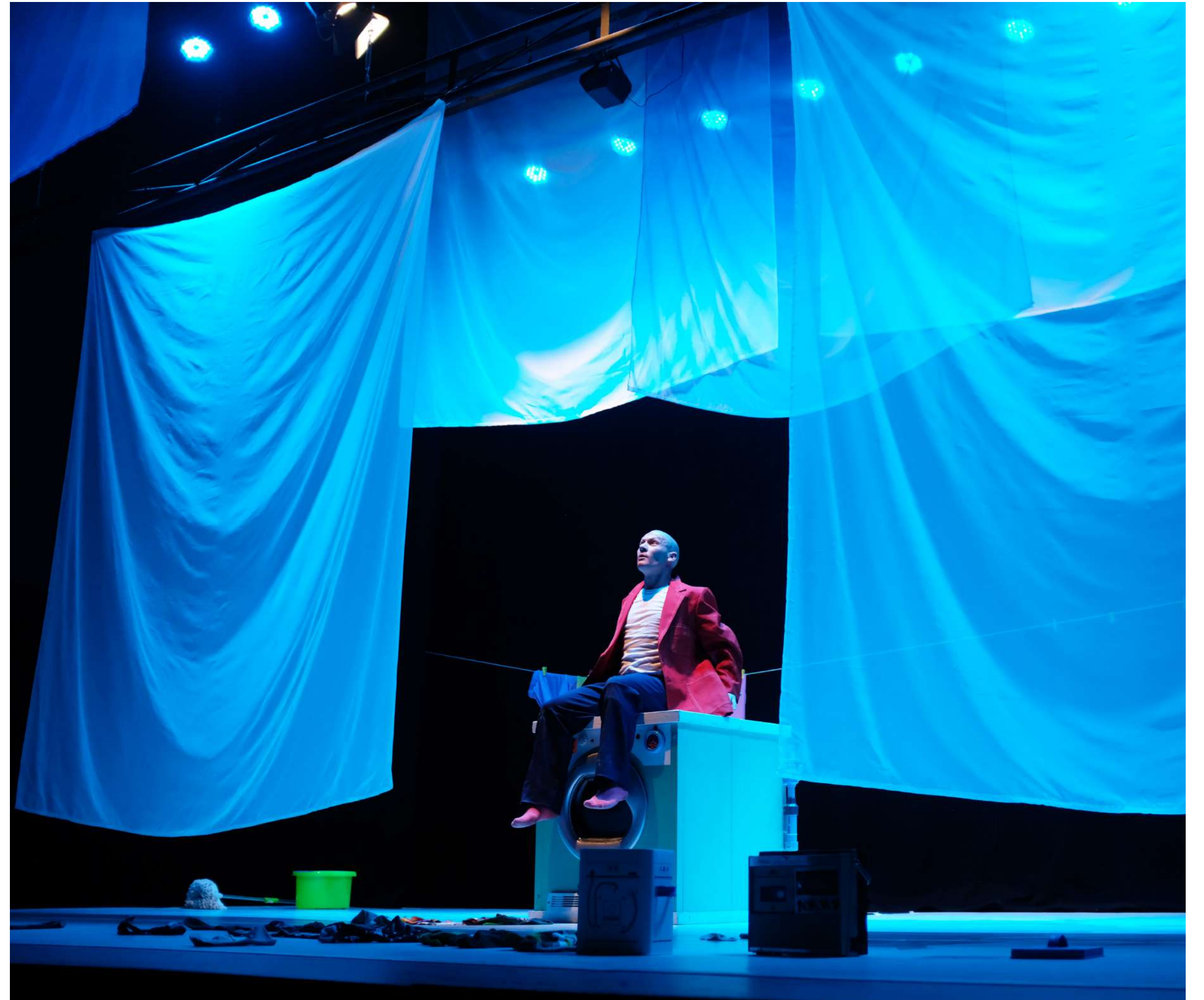
Teatro Mori de Recoleta (2023).