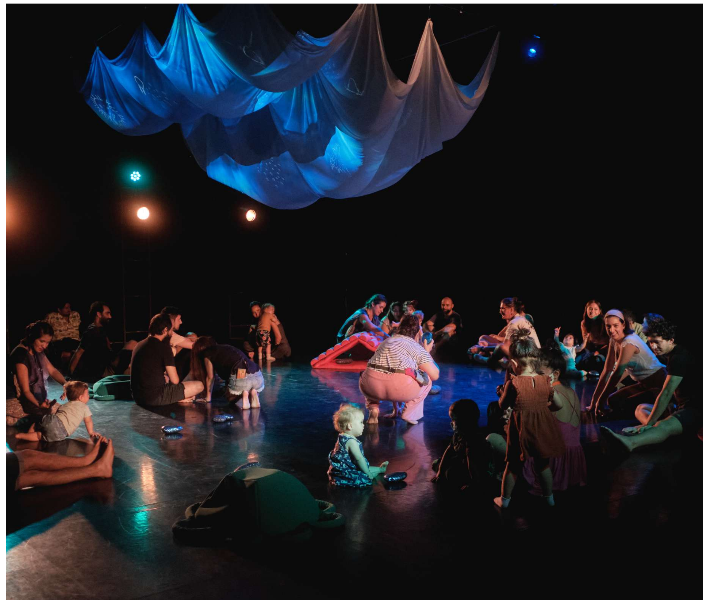
NAVE (2021).