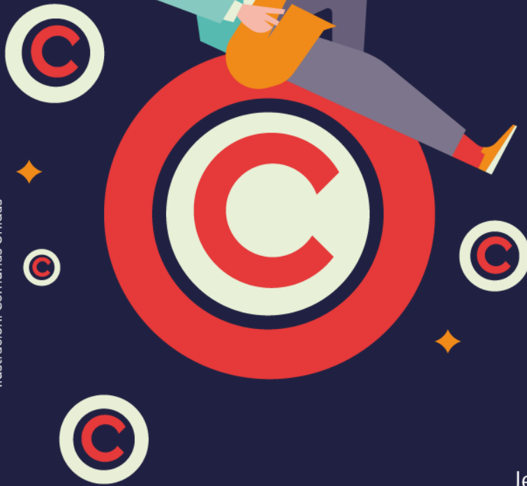
Ilustración: Comunas Unidas

© 2020 José Antonio Molina J. Jefe Unidad de Derechos de Autor Ministerio de las Culturas, las Artes y el Patrimonio