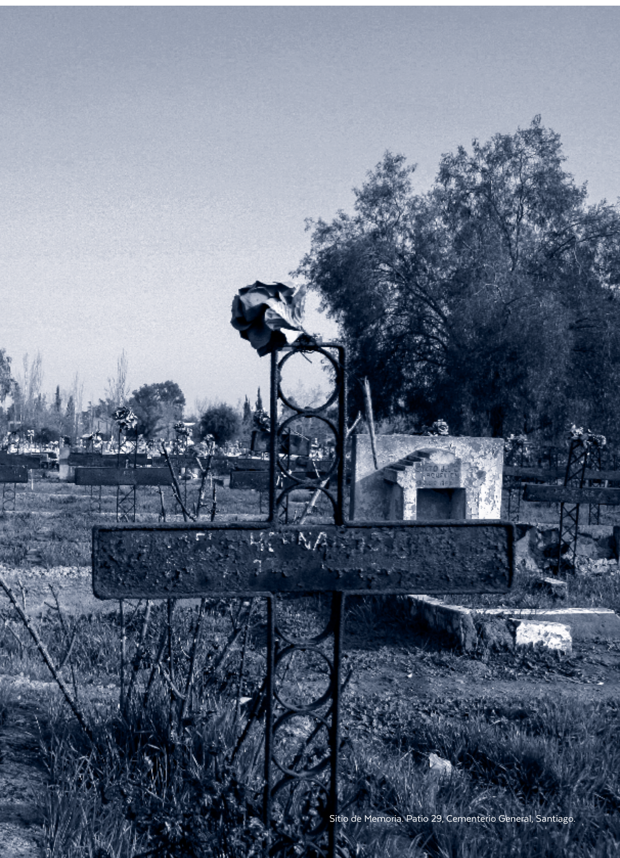
Sitio de Memoria, Patio 29, Cementerio General, Santiago.