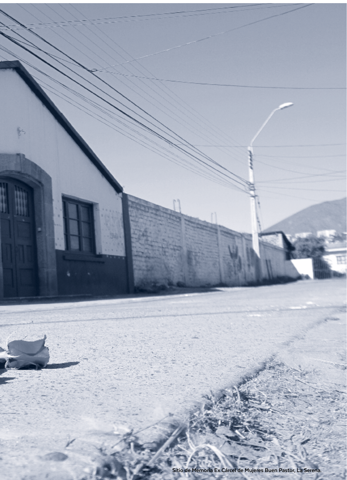
Sitio de Memoria Ex Cárcel de Mujeres Buen Pastor, La Serena.