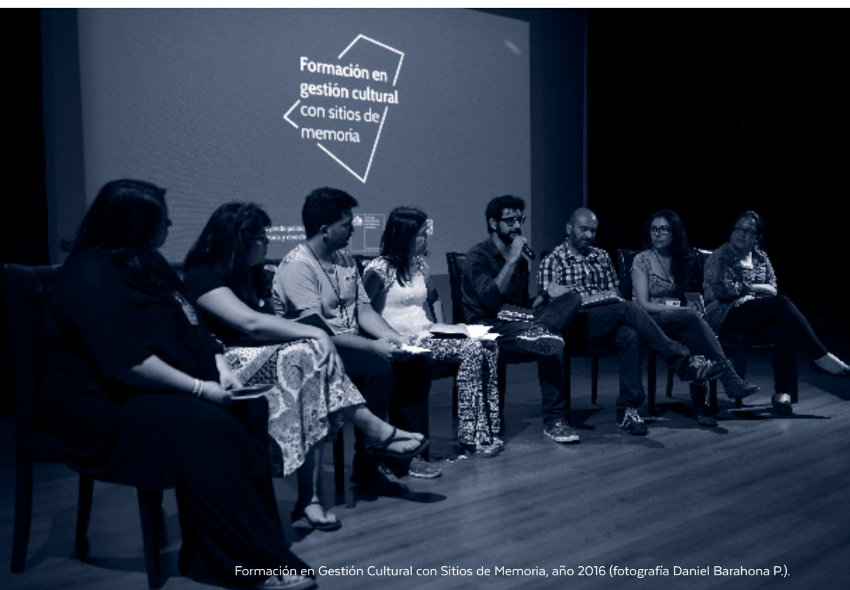
Formación en Gestión Cultural con Sitios de Memoria, año 2016.