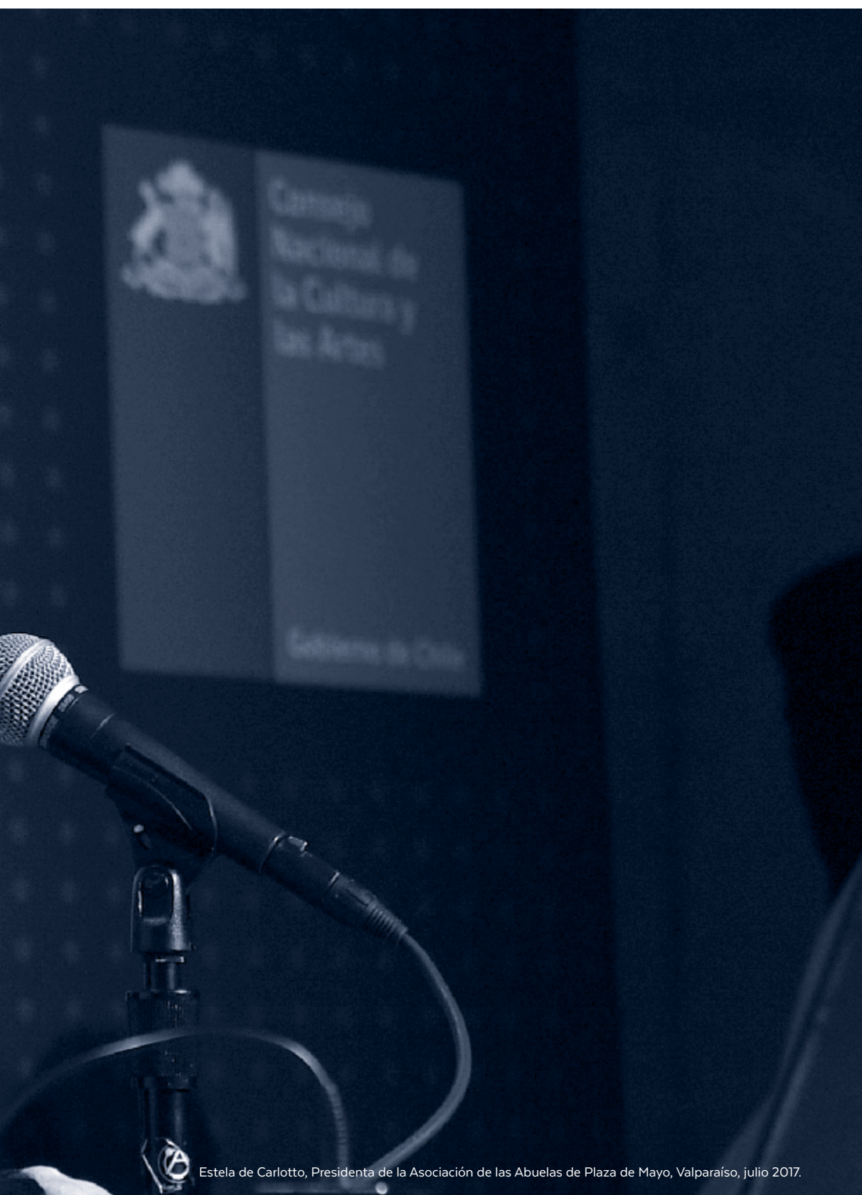
Estela de Carlotto, Presidenta de la Asociación de las Abuelas de Plaza de Mayo, Valparaíso, julio 2017.