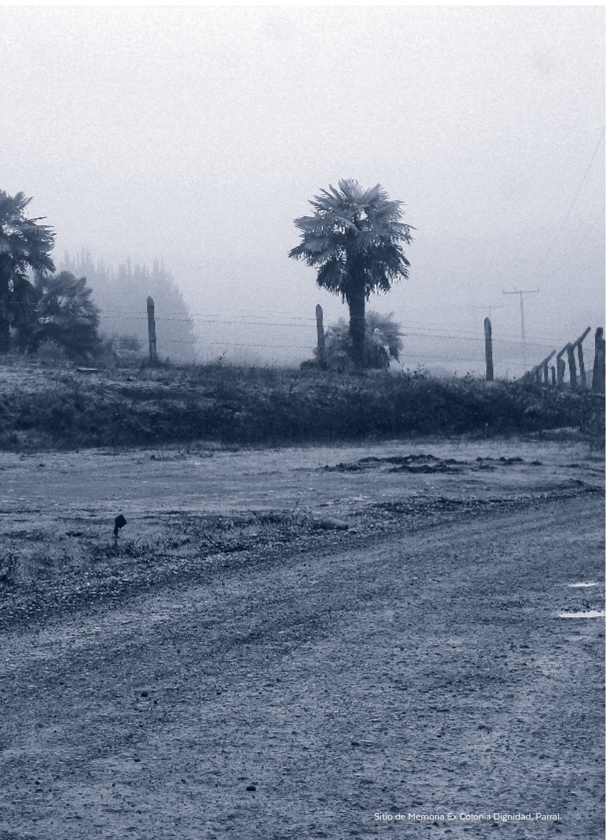
Sitio de Memoria Ex Colonia Dignidad, Parral.