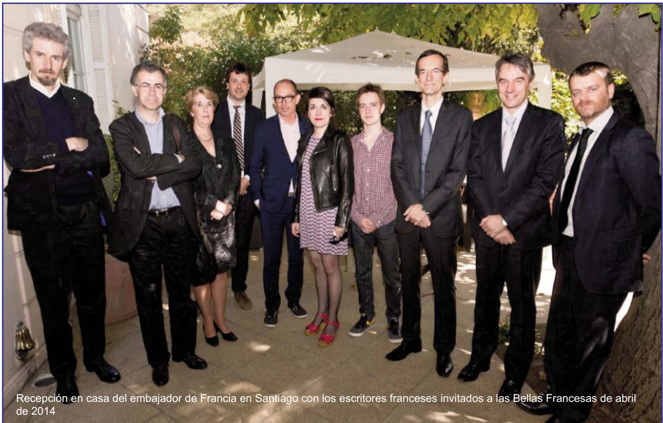
Recepción en casa del embajador de Francia en Santiago con los escritores franceses invitados a las Bellas Francesas de abril de 2014