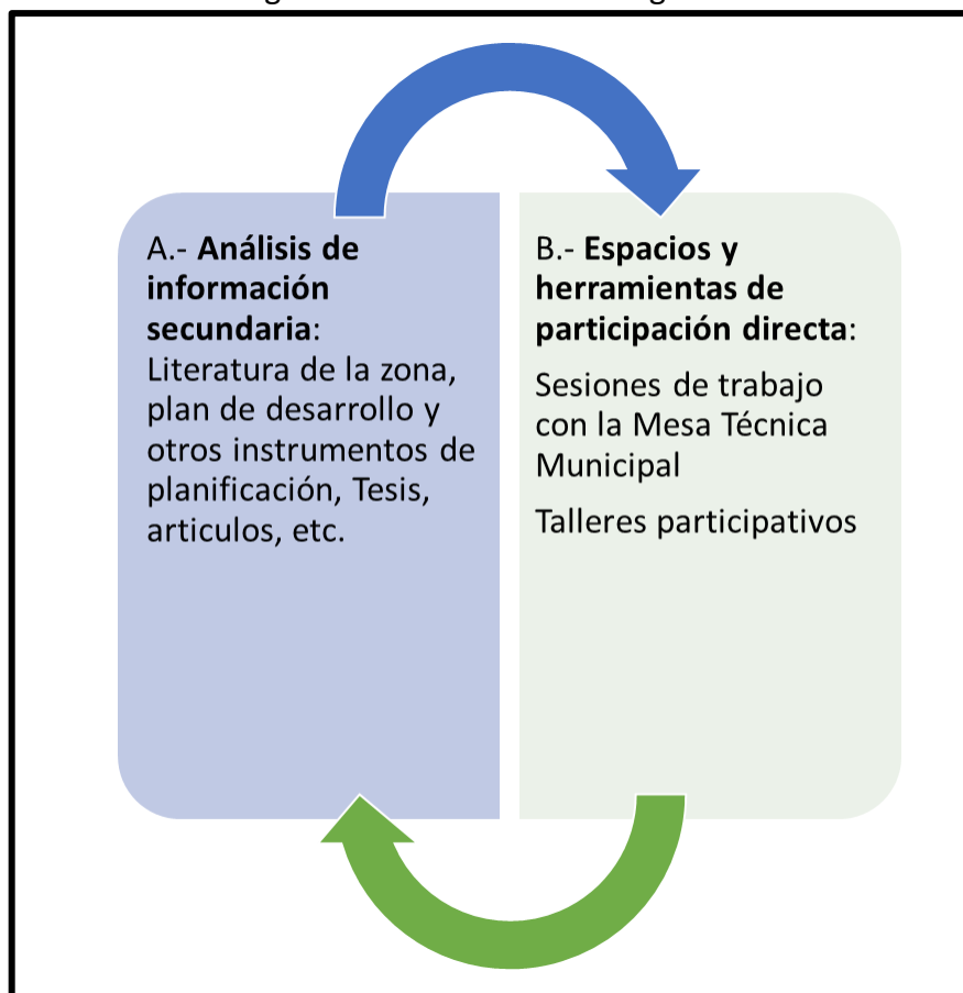
Diagrama 1: síntesis metodología PMC