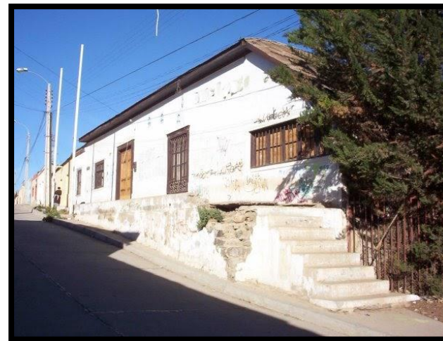
Imagen 8: Casa del Cirujano Videla

La Casa del Cirujano Videla en Andacollo es un inmueble histórico que perteneció a Pedro Regalado Videla, un destacado cirujano y héroe nacional chileno que participó en el Combate Naval de Iquique durante la Guerra del Pacífico. Nacido en Andacollo, Videla es reconocido por su valentía y dedicación en el ámbito médico y militar. La Casa del Cirujano Videla, despierta un alto interés, debido a su atractivo cultural y patrimonial.