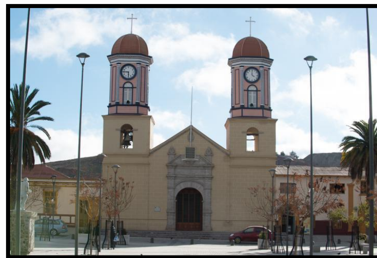
Imagen 2: Iglesia Chica

Al costado de la denominada iglesia chica, se encuentra un museo con reliquias de la misma iglesia, muchas de ellas fruto de las donaciones e indulgencias que las antiguas familias ofrecían en honor a la fe que profesaban.