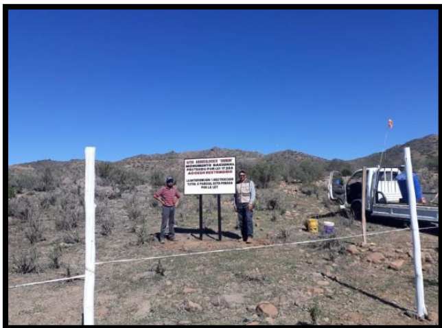
Imagen 9: Registro sitio arqueológico Andacollo