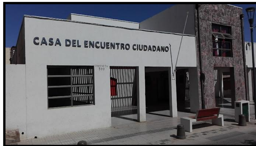
Imagen 15: Frontis Casa de la Cultura

Además, el espacio cohabita con la sala museográfica, la cual cuenta la historia de Andacollo, y que también ofrece una variedad de actividades culturales y educativas, incluyendo exposiciones y otras actividades preocupadas del rescate patrimonial de la comuna, convirtiendo el espacio en general, en un gran núcleo de intercambio cultural y artístico para la comuna.