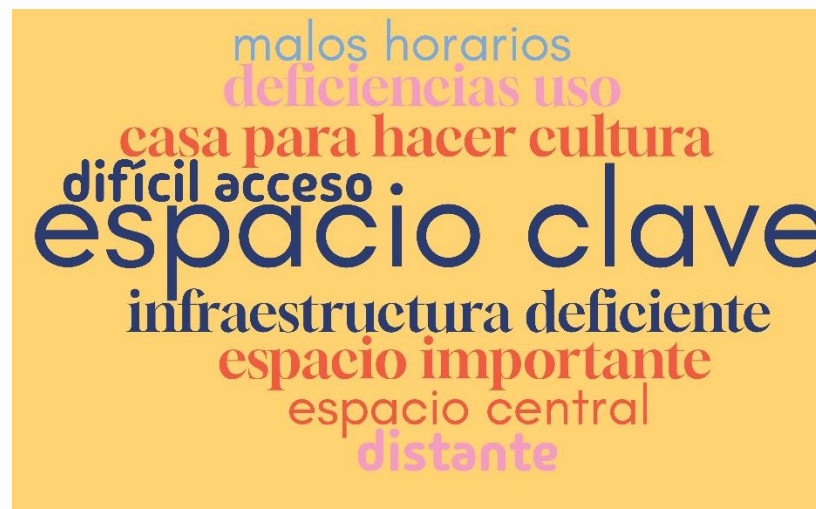
Imagen 16: Conceptos clave