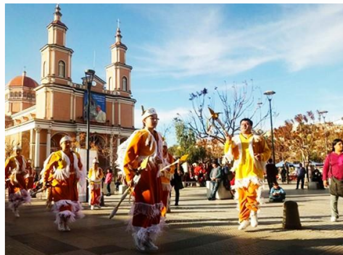
Imagen 12: Baile religioso

Estos se realizan principalmente por hermandades cristianas, cuyos miembros utilizan la expresión artística de manera tradicional y con sentido de oración. Son expresiones de arte ritual de origen andino, dirigidas hacia la madre de Jesús y también hacia el niño Dios, santos, patronos y a la Santa Cruz. La comuna cuenta con un importante número de agrupaciones dedicadas a esta disciplina artística y cultural, siendo Andacollo, la comuna que acogió al primer grupo de baile que llegó a danzar a los pies de la virgen en 1584, denominado “Chino”, y que es considerado el padre de los bailes religiosos de Chile.