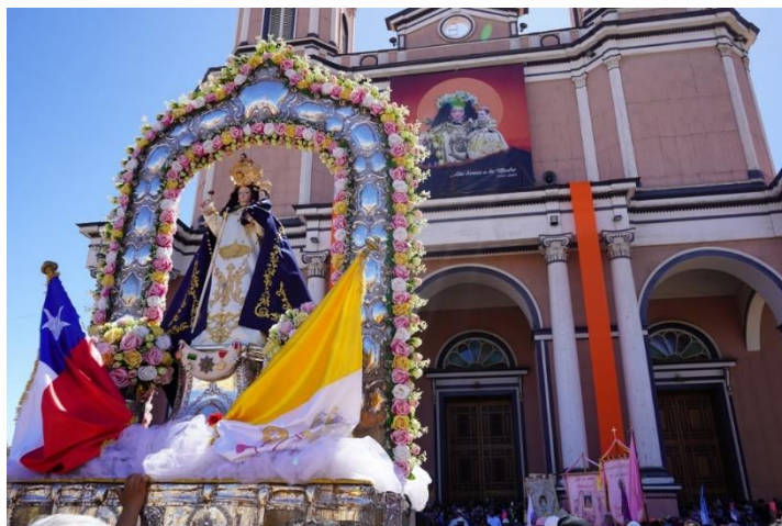
Imagen 13: Fiesta de la virgen de Andacollo