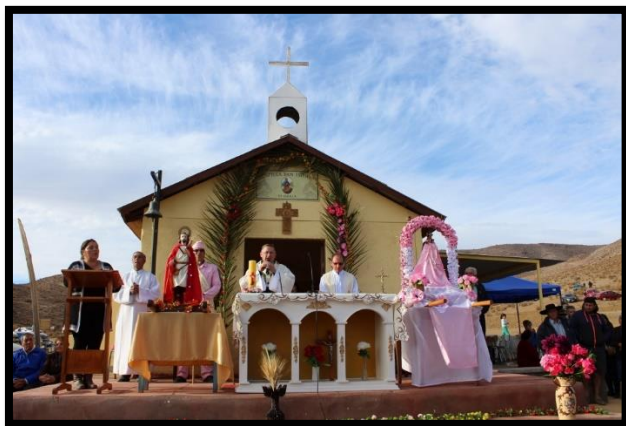
Imagen 5: Capilla San Isidro