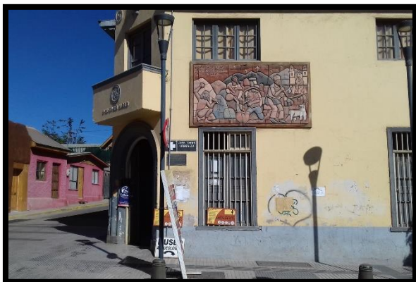
Imagen 7: Exterior Museo Yahuin