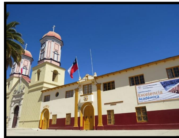
Imagen 6: Colegio Parroquial