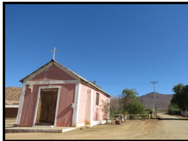
Imagen 4: Iglesia de El Toro

Iglesia con gran antigüedad y valor patrimonial, donde se celebra usualmente la fiesta patronal de la Cruz de Mayo. La ceremonia comienza normalmente con la celebración de una misa y posteriormente se efectúa la procesión de la Cruz de Mayo la que recorre todo el poblado de El Toro, acompañando a miles de feligreses, bailes religiosos y la santa Cruz.