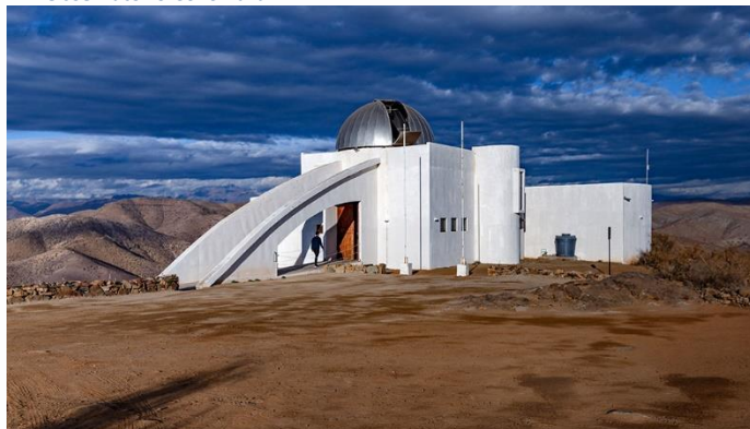
Imagen 11: Observatorio Collowara