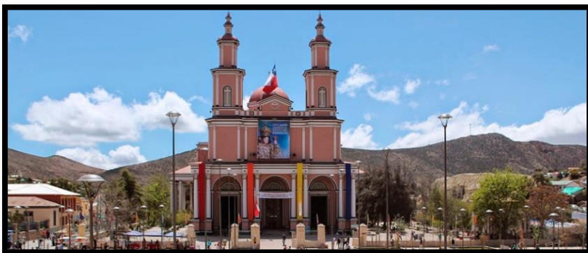
Imagen 3: Basílica

Es una de las obras arquitectónicas más importantes de la comuna, antiguamente se le llamaba iglesia grande. Hoy la basílica y la iglesia Chica son dos monumentos nacionales con los que cuenta la comuna de Andacollo.