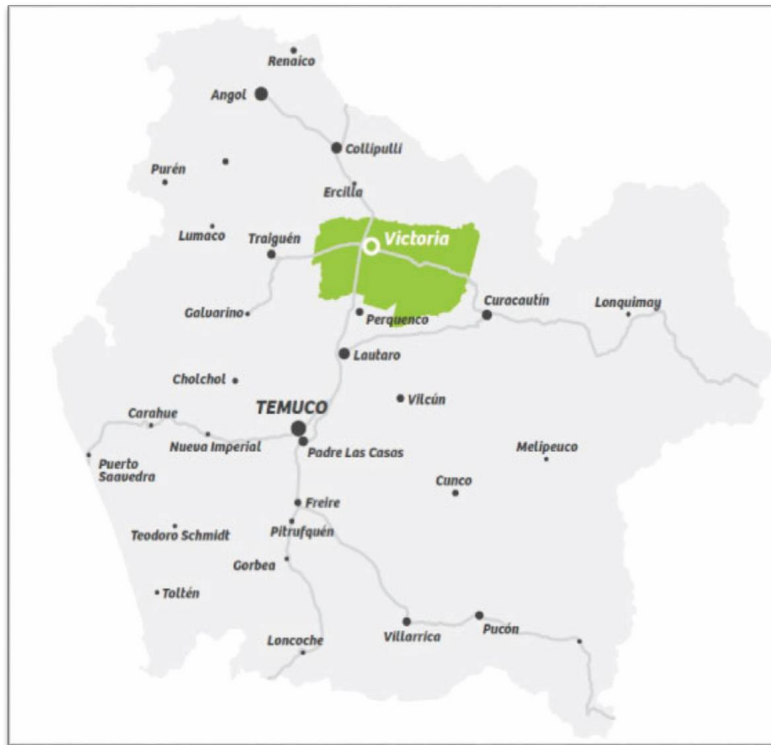
Ilustración 1: Mapa comuna de Victoria