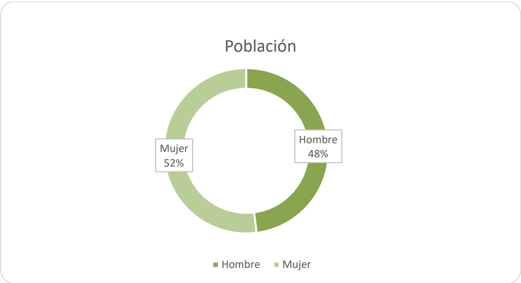
Gráfico 1: Distribución de la población por sexo en la comuna de Victoria