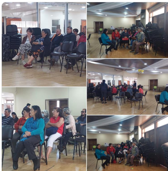
Tabla Resultado propuestas de Reconocimiento a pueblos indígenas.

Hemos resumido los resultados de estas reuniones en el siguiente cuadro para una mejor comprensión del análisis que los mismos vecinos realizan del desarrollo cultural en la comuna en los últimos años.