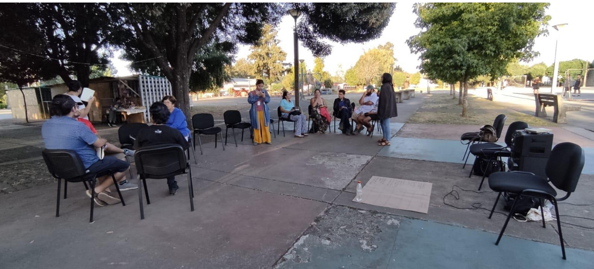
Reunión participativa territorial para toda la comunidad de Huis capi en la Plaza de Huis capi