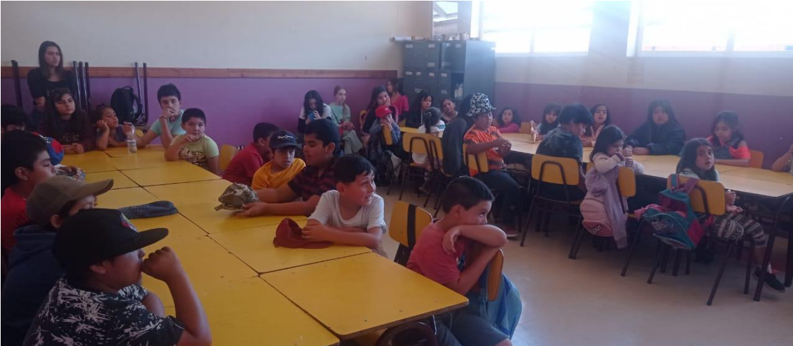
Reunión participativa sectorial de niñas, niños y adolescentes en jornada de escuela de verano en Escuela Alborada