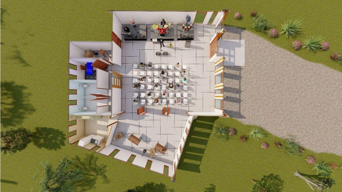
Imagen Interior Casa de la Música.