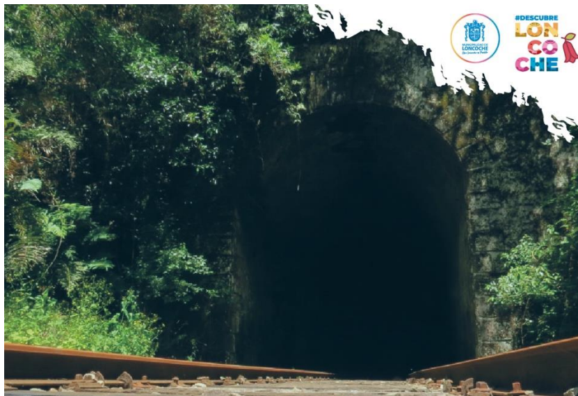
Imagen antigua línea férrea.

Algunos objetos de valor patrimonial se guardan en el Museo Municipal, pero requieren de una mejor capacidad de protección, cuidado y exhibición.