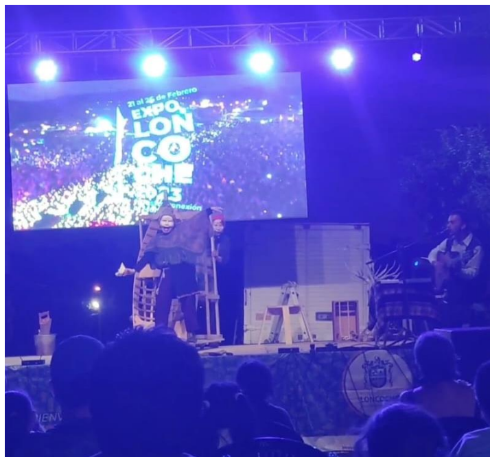
Obra de Teatro de la Compañía Periplos de Valdivia, gestionada por la Ilustre Municipalidad de Loncoche en colaboración con el Centro de Emprendimiento Loncoche.