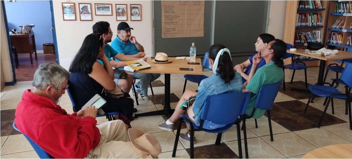
Cabildo abierto para toda la comunidad en Biblioteca Municipal