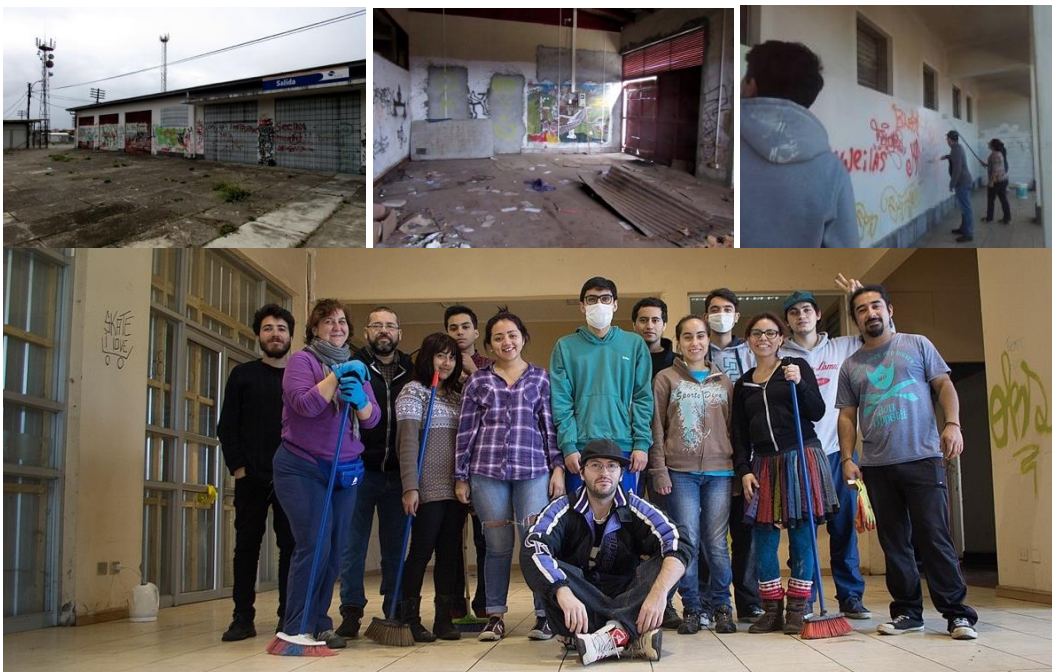
Etapa de limpieza y habilitación Centro Cultural Estación.