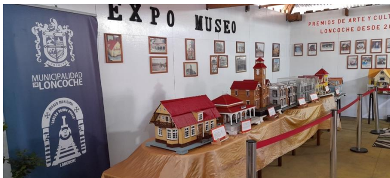
Exposición realizada en Biblioteca Pública.

Nueve de estas acciones se realizaron en sectores rurales. De las 43 acciones restantes se realizaron 10 en la plaza de armas, 7 en la biblioteca, 7 en Centro Cultural estación, 7 en establecimientos educacionales, 5 en poblaciones, 5 en gimnasio, 1 en municipalidad y uno en Ciam/Estación.