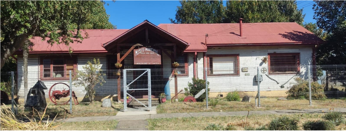
Museo Municipal de Loncoche. Fuente Fan Page Museo Municipal de Loncoche.

Además, se realizan actividades culturales en espacios no habilitados para actividades artístico-culturales dependientes de la municipalidad como el Gimnasio Municipal, la Parcela Municipal y en el Centro Integral del Adulto Mayor. También se utilizan escuelas tanto urbanas como rurales, así como sedes de Juntas de Vecinos, canchas deportivas y plazas urbanas y rurales.