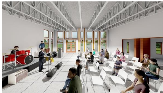
Imagen Interior Casa de la Música. Fuente Fan Page Municipalidad de Loncoche.

De estos acuerdos destacamos el que está con mayores avances que es el DISEÑO DE LA CASA DE LA MUSICA . Cuenta con una superficie proyectada para su construcción de 242m 2 , que será emplazada en el ex Instituto de Educación Rural, IER. Este espacio cultural contará con una sala multiuso principal de doble altura, que se podrá utilizar para presentaciones y reuniones, sala de ensayo, cocina, 2 baños universales dividido por géneros, oficina administrativa y oficina para bodega y archivos. La inversión supera los $130 millones de pesos. La Casa sería entregada en administración a la centenaria Banda Santa Cecilia, que por años se ha visto postergada de un lugar digno para sus ensayos y punto de encuentro, permitiéndoles seguir potenciando a niños, niñas y jóvenes en su crecimiento artístico y personal.