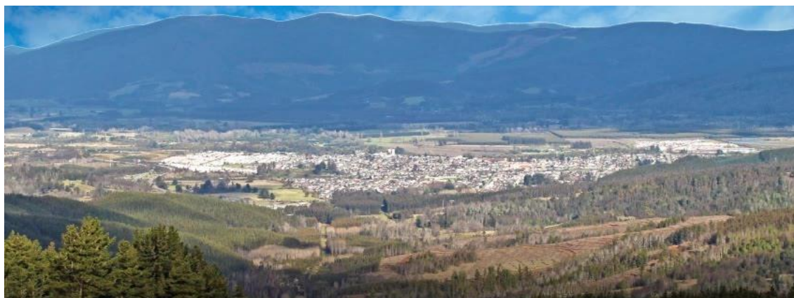
Vista aérea de Loncoche.

Si el análisis se realiza por la cantidad de trabajadores dependientes por rubro, el primer lugar lo tiene la administración pública y defensa con 22,8% de los trabajadores de la comuna seguidos del rubro de industria manufacturera con 18,3% y construcción con 17,2% 23 .