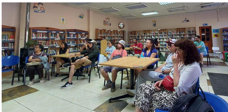
Tabla Resultado propuestas de Participación y acceso a la cultura.