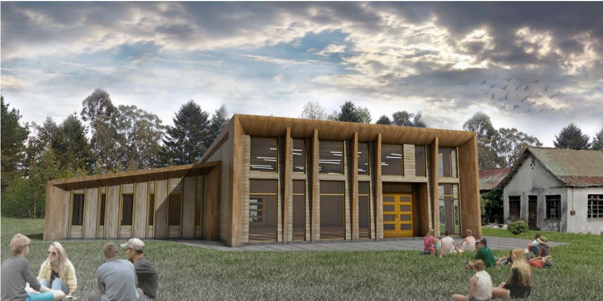
Imagen Interior exterior Casa de la Música.