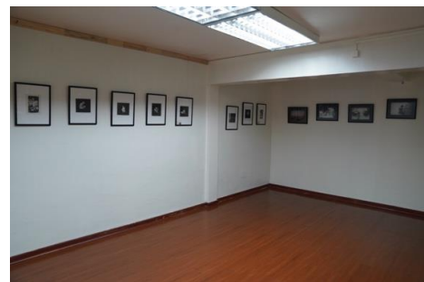
Biblioteca Pública de Loncoche.

Museo Municipal Carlos Ochoa Oyarzo: El museo se ubica a cuatro cuadras de la plaza principal. Es una casa de madera que se ha hecho pequeña ante la colección que aumenta periódicamente con donaciones de vecinos. El paso del tiempo y la falta de recursos para una mantención más adecuada se evidencia en el deteriorado estado del edificio. La actual administración mantiene activa la creación de un proyecto que permita un edificio moderno adecuado para albergar el espacio museístico de la comuna.