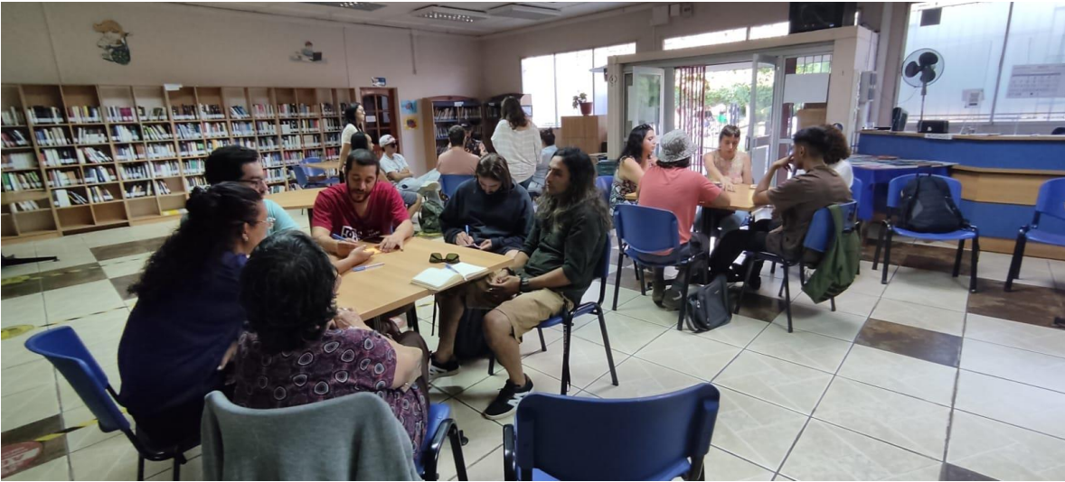
Reunión participativa sectorial de agentes culturales en la Biblioteca Municipal