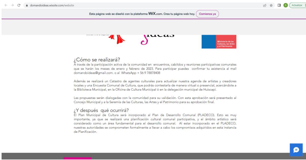
Plataforma web de Domando Ideas para acceder a la encuesta cultural y el catastro de artistas

Recolección de fuentes secundarias: El análisis de información secundaria también fue parte del trabajo realizado para la elaboración del diagnóstico que da sustento a la propuesta estratégica de este Plan Municipal de Cultura, logrando la revisión de documentación y de insumos proporcionados por el departamento de cultura y diferentes departamentos y direcciones municipales respecto al trabajo implementado por el municipio, además del cotejo de otros datos secundarios a modo de relevar el contexto comunal. Parte de estos documentos fueron: