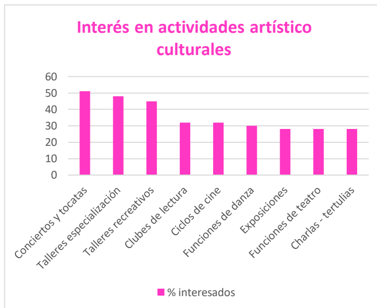
Gráfico Interés en actividades culturales.

Al medir el grado de satisfacción con las actividades artísticas culturales de la comuna , el 53% de los encuestados se encuentra satisfecho con las actividades que se realizan desde el área de cultura municipal, y 16% se encuentra muy satisfecho. Sólo un 5% se encuentra muy insatisfecho con las actividades y un 15% insatisfecho. Entonces podemos decir que el grado de aceptación es mayoritario llegando casi al 70% de los encuestados.