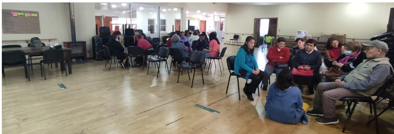
Reunión participativa en el Centro Integral del Adulto Mayor (CIAM) con personas mayores e inclusión

Reuniones participativas: Fueron encuentros de conversación y discusión, en donde se explicó en qué consiste un Plan Municipal de Cultura, la importancia de que este sea escrito en base a las necesidades culturales de la gente y lo primordial que es que se ejecute. También se generó debate abierto para promover la evaluación crítica de los participantes en cuanto a logros, desafíos y propuestas para la cultura local. Para comprometer una mirada más proactiva se solicitó responder en grupos, tres puntos logrados y también tres posibles soluciones a problemáticas observables en cada uno de los seis ejes estratégicos presentes en las políticas culturales regionales (a. Participación y acceso a las artes y las culturas; b. Fomento de las artes y las culturas; c. Formación y sensibilización artística y patrimonial de la ciudadanía; d. Rescate y difusión del patrimonio cultural; e. Puesta en valor de espacios culturales ciudadanos; f. Reconocimiento de los pueblos indígenas). De estas reuniones se hicieron algunas con enfoques territoriales por zonas de la comuna, y otras sectoriales por grupos de representación, siendo la municipalidad la responsable de la convocatoria.