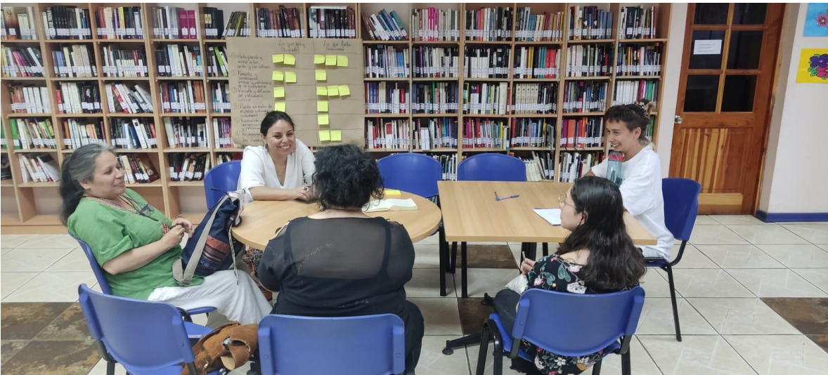
Reunión participativa sectorial de mujeres y diversidades sexogenéricas en Biblioteca Municipal