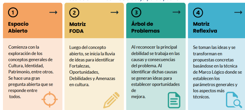
Ilustración 2: Matriz de trabajo participativo