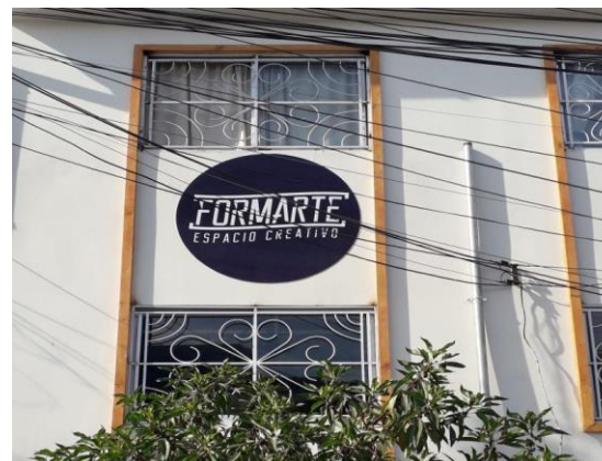
Ilustración 1 Formarte

El segundo hito en la evolución de este colectivo se materializó el 3 de enero de 2020 con la creación de Formarte, un espacio dedicado a la creación, la búsqueda, la exploración, la investigación y la experimentación en diversas áreas artísticas. Este espacio fue concebido con la finalidad de contribuir al crecimiento y desarrollo tanto de los individuos como de la comunidad en la que se inserta. Estratégicamente ubicado en el corazón de la población Caupolicán, el colectivo aboga por el trabajo colaborativo y el intercambio, facilitando la colaboración entre artistas dispuestos a aportar herramientas que respalden la formación artística y el desarrollo del trabajo comunitario.