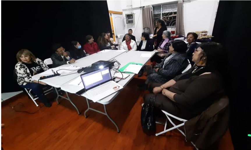
Imagen 3: Encuentro con adultas mayores, 31-07-23 19:30 hrs