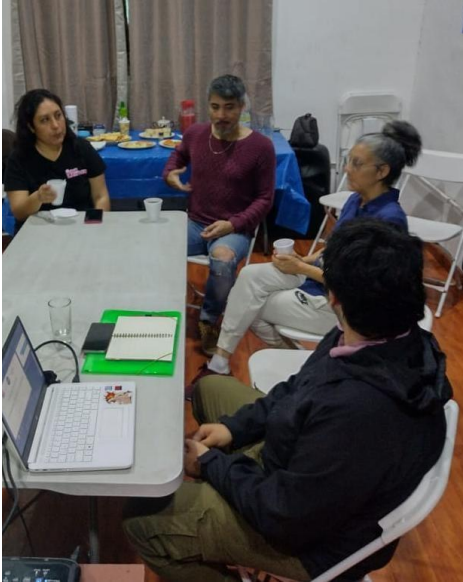
Imagen 6: Mesa técnica de Validación 25 de septiembre. 19:15 hrs.