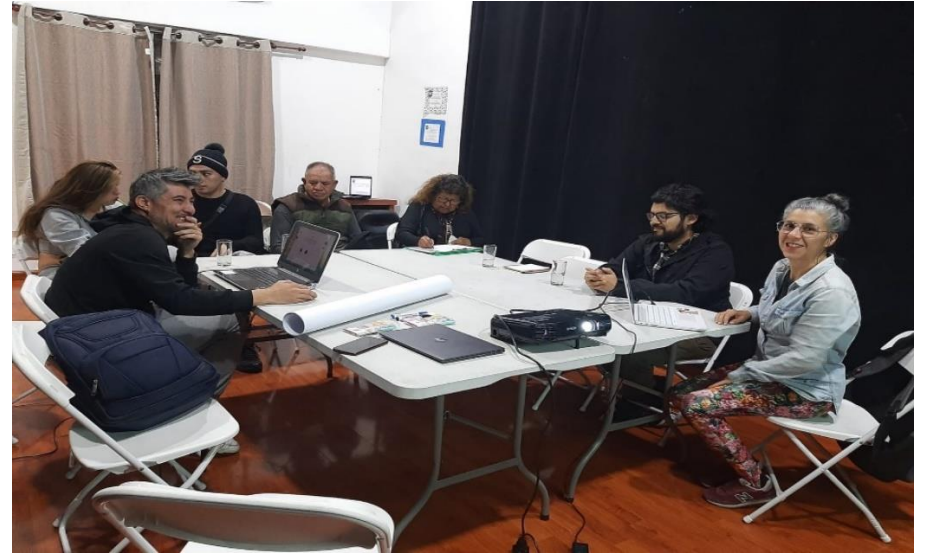
Imagen 5: Encuentro con organizaciones Sociales, 02-08-23 19:00 hrs