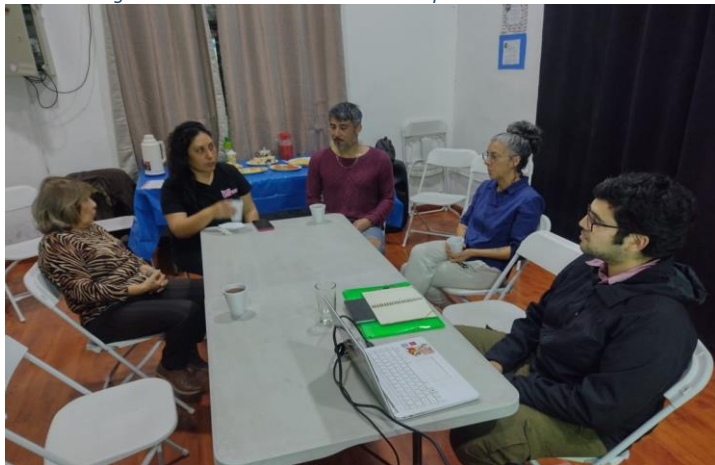
Imagen 7: Validación ciudadana 25 de septiembre de 2023. 20:00