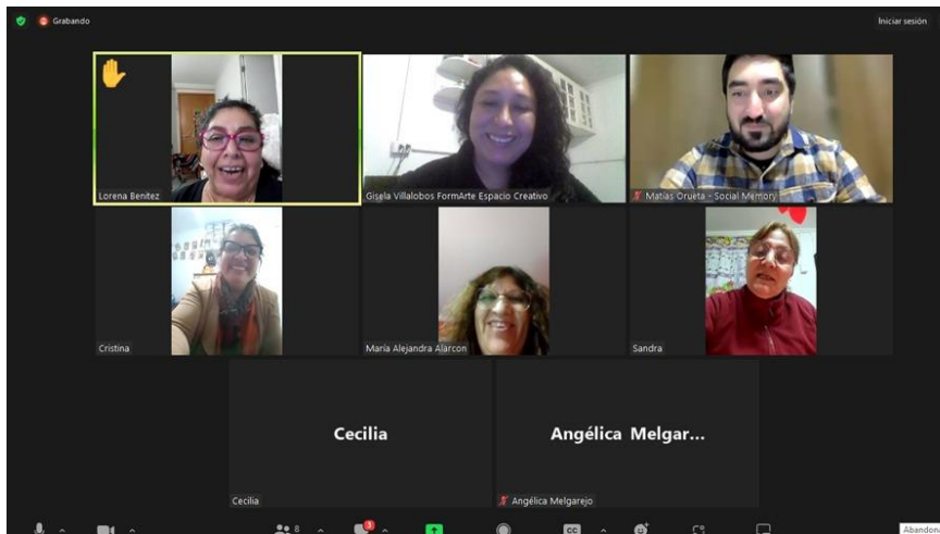
Imagen 4: Encuentro con Madres 17-08-23 19:00 hrs