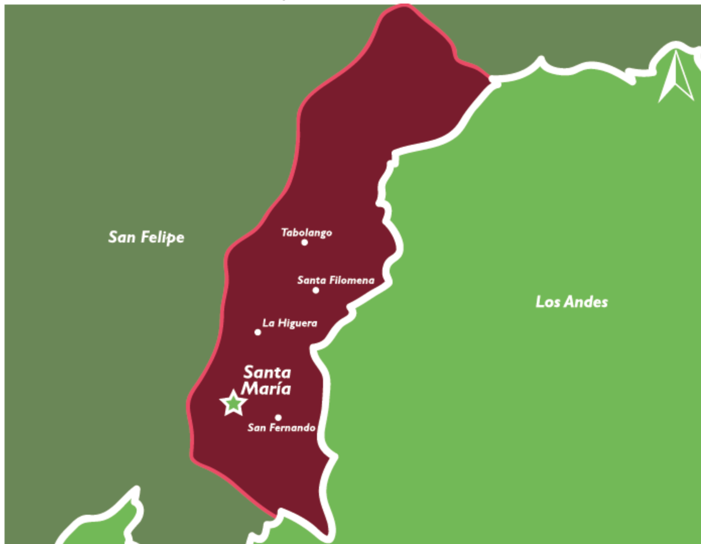
Mapa comuna de Santa María