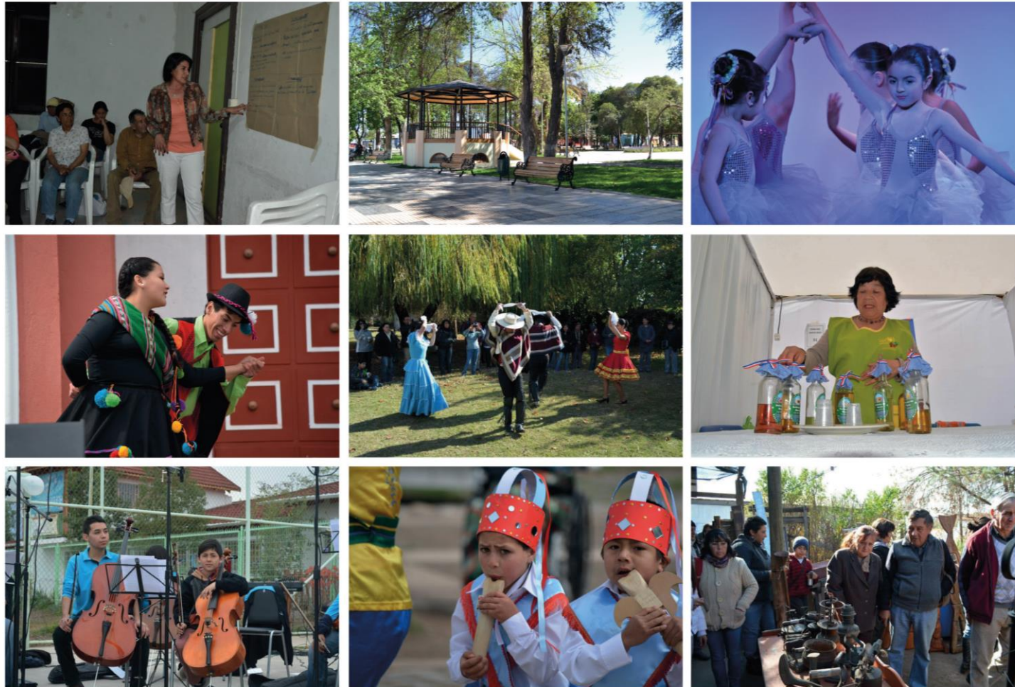
Foto 1: Reunión Sector El Llano, Santa María / Foto 2: Plaza de Armas Santa María/ Foto 3: Gala Taller de Ballet 2014 Foto 4: Feria del Olivo 2014 / Foto 5: Día del Patrimonio 2014/ Foto 6: Feria del Olivo 2014 Foto 7: Orquesta Sinfónica Juvenil/ Foto 8: Feria del Olivo 2014 / Foto 9: Día del Patrimonio 2014