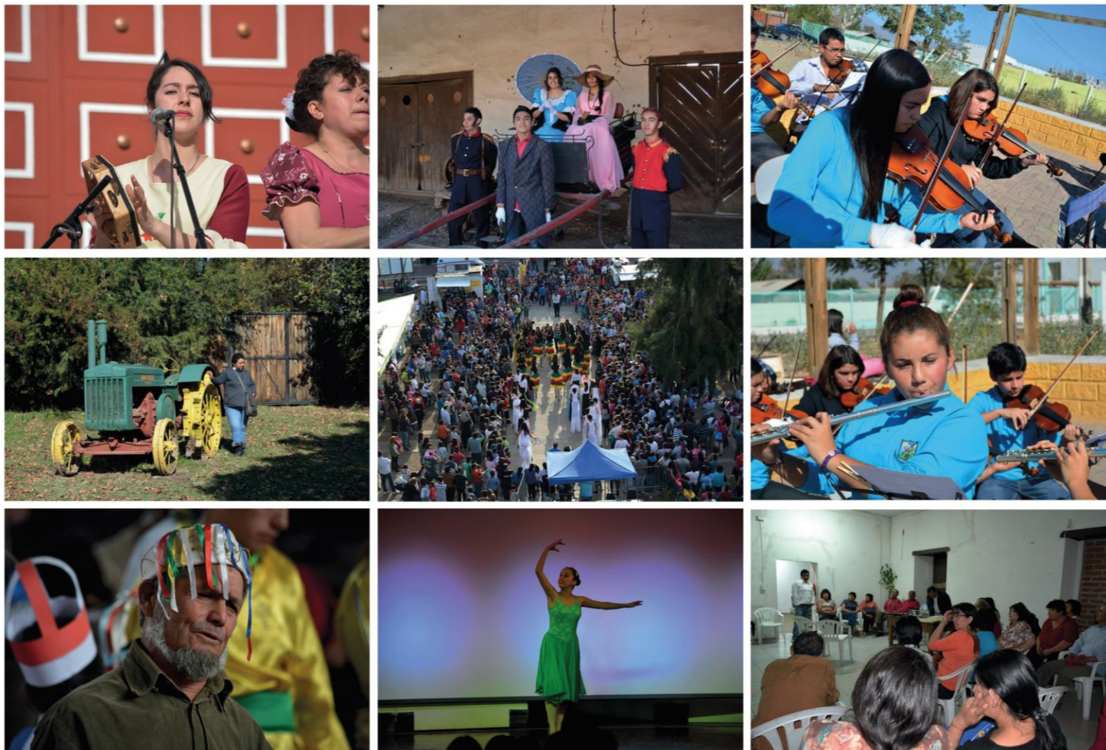
Foto 1: Feria del Olivo 2014 / Foto 2: Día del Patrimonio 2014 / Foto 3: Orquesta Sinfónica Juvenil Foto 4: Día del Patrimonio 2014 / Foto 5: Feria del Olivo 2014 / Foto 6: Orquesta Sinfónica Juvenil Foto 7: Feria del Olivo 2014 / Foto 8: Gala Taller de Ballet 2014 / Foto 9: Reunión Sector El Llano, Santa María