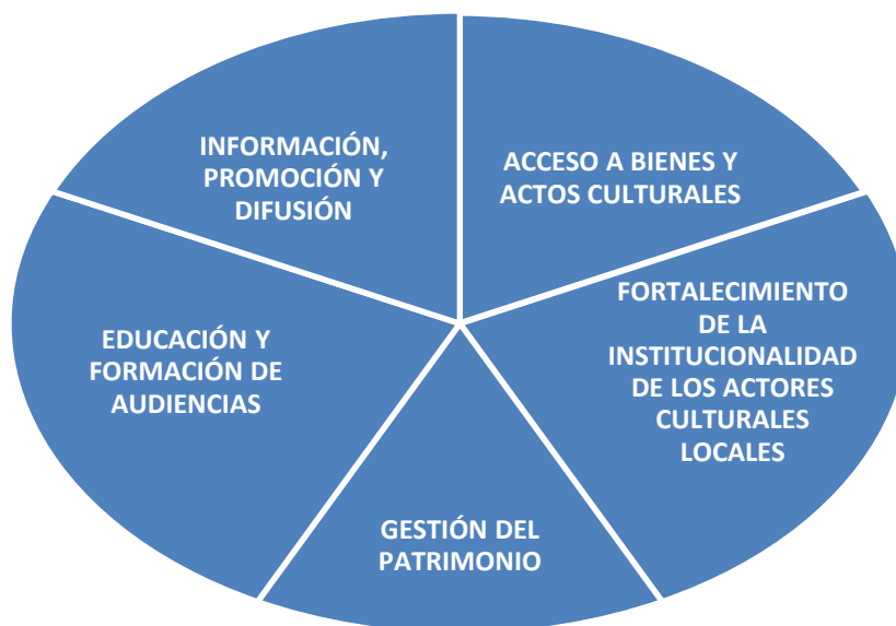
Figura N°1: Ejes Estratégicos

En el contexto anterior, se muestra el siguiente esquema que corresponde a la propuesta estratégica para el periodo 2017-2020.