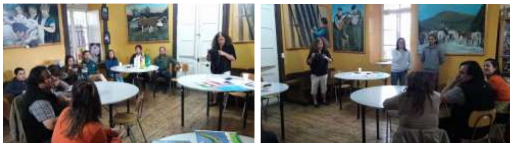
Validación PMC con comunidad y artistas de Romeral

Fortalecer la institucionalidad cultural comunal desde una dimensión integradora, mejorar y diversificar la infraestructura e incorporar la planificación como sistema de trabajo son las áreas que aglutinan los proyectos que buscan caracterizar la gestión cultural municipal de Romeral.