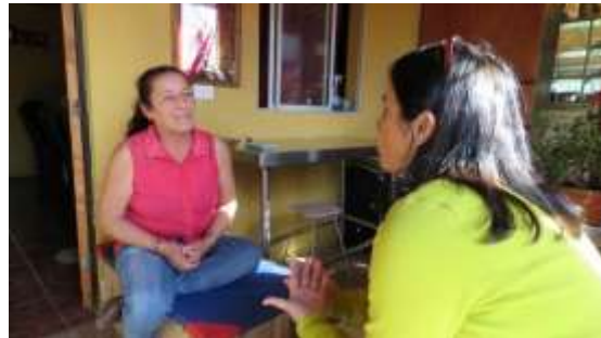
Entrevista con Cristina Donoso, destacada folclorista, artesana, compositora y cantante popular de la comuna