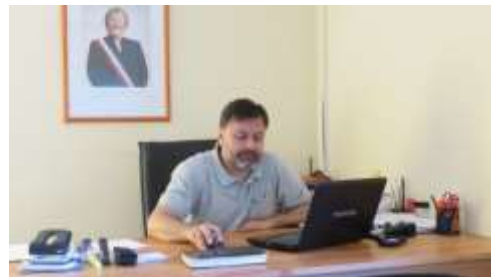
Entrevista con Director de Desarrollo Comunitario de Romeral