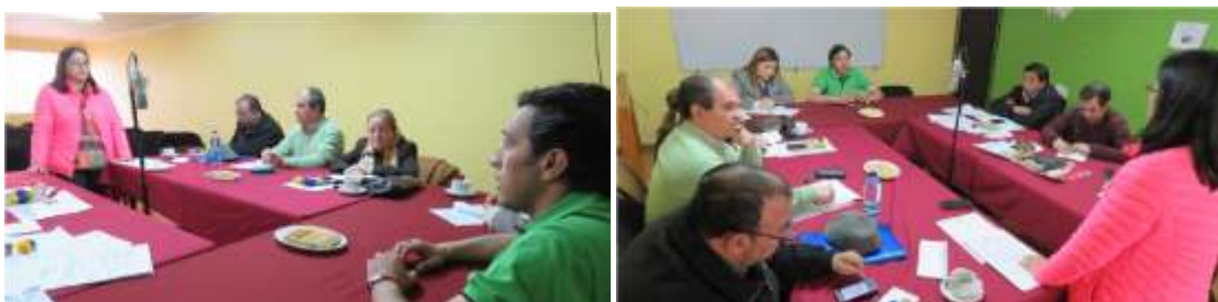
Reuniones Técnicas con Consejo Municipal y Domando Ideas para diagnóstico de PMC

Entrevistas: Se confeccionó una Pauta de Entrevista semiestructurada, directamente relacionada con los objetivos y temas de interés de la investigación. La entrevista semiestructurada, como recurso metodológico, proporciona el acceso a la visión y percepción del actor en torno a las temáticas abordadas en las entrevistas. Para la aplicación de ellas se ha definido una lista de tópicos (caracterización del consumo y la oferta cultural, el financiamiento, visión de futuro, participación y difusión, etc.) en los que se centra la conversación, permitiendo indagar en las representaciones, percepciones, temores y expectativas, respecto a la vida artística y cultural comunal, pero sin sujetarse a un interrogatorio rígidamente estructurado. Esto permite adaptar cada conversación a las características del entrevistado, poniendo énfasis en aquellos aspectos en que éste tiene mayor conocimiento o experiencia, por lo que sus opiniones pueden resultar particularmente relevantes.