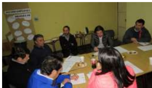
Reunión con Directorio Corporación Cultural de Romeral y Domando Ideas por diagnóstico PMC