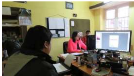
Reuniones de trabajo con equipo Corporación Cultural de Romeral y Domando Ideas