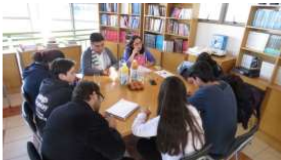
Encuentro focal con Centro Alumnos Liceo de Romeral

Una característica importante de la intervención en la comuna de Romeral, es que el estudio comenzó mucho antes con trabajos de diferentes equipos, los que también fueron revisados y recogidos en esta metodología de trabajo. Se logró así elaborar la primera parte del diagnóstico que además pudo ser contrastada con los avances logrados al día de hoy. La revisión de estas intervenciones se resume en los siguientes puntos: