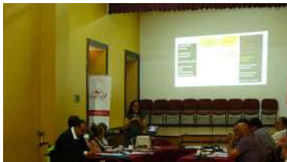
Reuniones de presentación y validación PMC en Consejo Municipal de Romeral