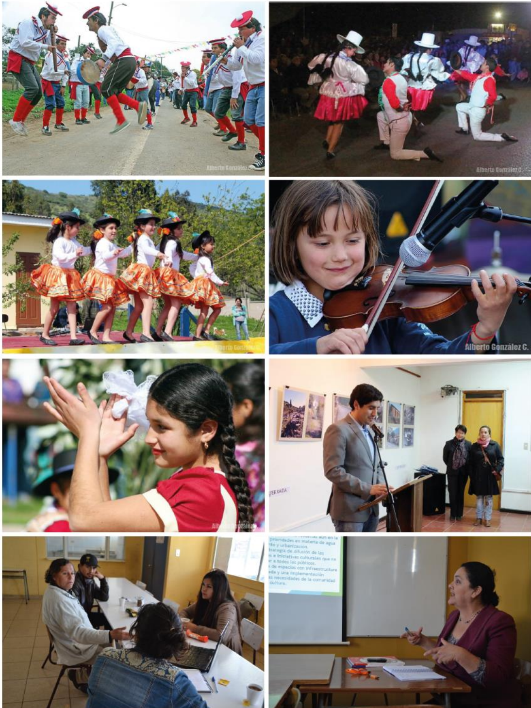
Foto 1: Fiesta de la Virgen del Carmen en El Rincón / Foto 2: Festival del Folclor Latinoamericano 2014 / Foto 3: 1ª Feria Costumbrista Esc. Básica El Rincón / Foto 4: Día del Artesano 2014 / Foto 5: 1ª Feria Costumbrista Esc. Básica El Rincón / Foto 6: Exposición Fotográfica Las 22 localidades de Puchuncaví / Foto 7: Talleres participativos, Horcón / Foto 8: Reunión DAEM y Directores de Escuela