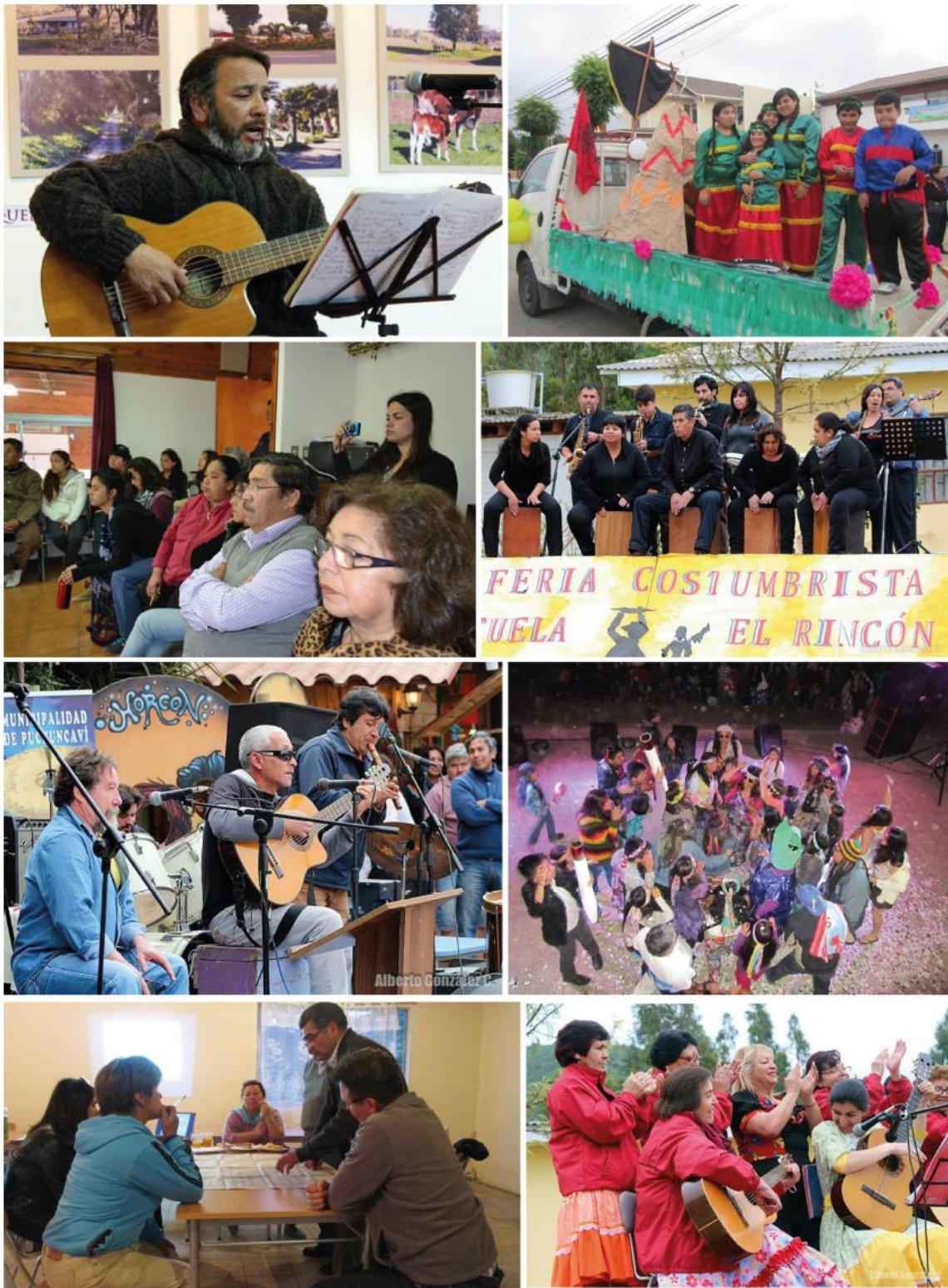
Foto 1: Exposición Fotográfica Las 22 localidades de Puchuncaví / Foto 2: Fiesta de la Primavera 2014 / Foto 3: Reunión UNCO Cultura Puchuncaví / Foto 4: 1ª Feria Costumbrista Esc. Básica El Rincón / Foto 5: Día del Patrimonio 2014 / Foto 6: Feria del Olivo 2014 / Foto 7 Reunión Los Maquis / Foto 8: 1ª Feria Costumbrista Esc. Básica El Rincón