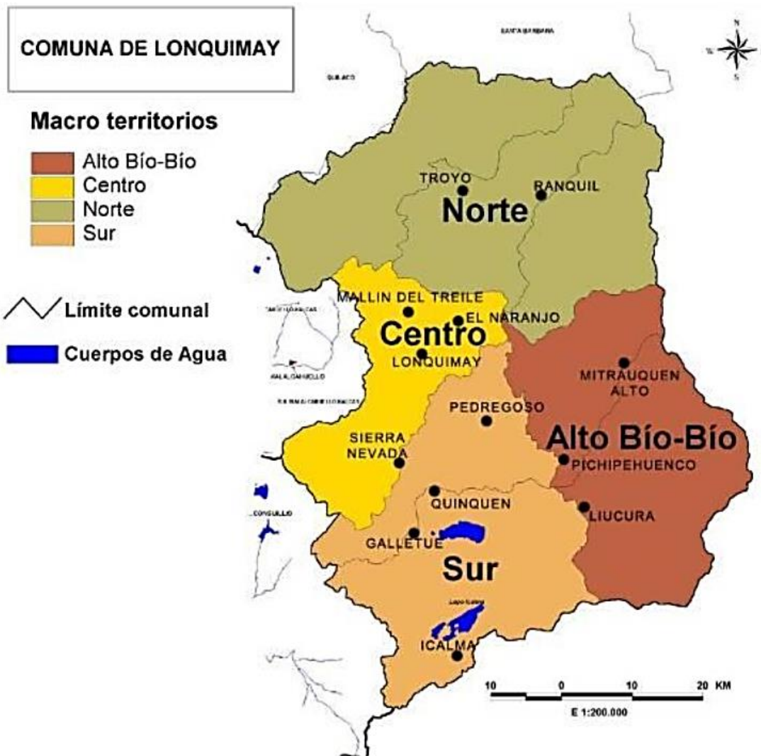
Ilustración 2: Macro sectores Lonquimay (Fuente: PLADEC 2018-2022)

Lonquimay se caracteriza por presentar un clima de estepa fría, con una fuerte erosión eólica debido a la composición volcánica del suelo y la baja cobertura vegetal en sectores determinados. Además, presenta inviernos extremos en cuanto a temperaturas y cantidad de nieve caída, lo que limita las actividades agrícolas durante estos meses.