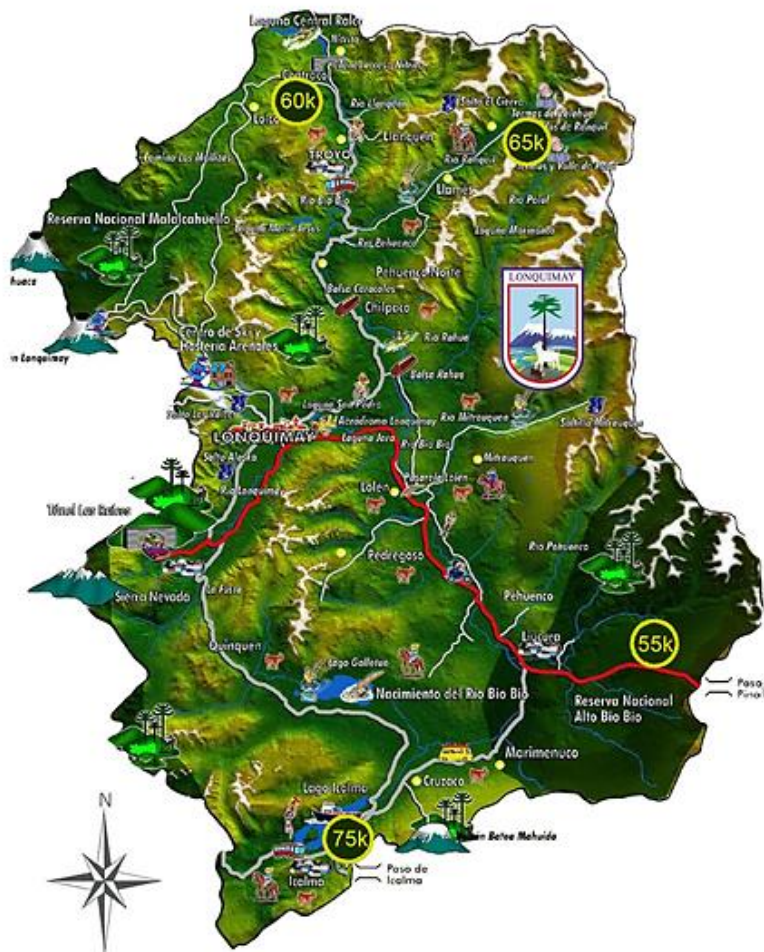
Ilustración 1: Comuna de Lonquimay

Esta comuna cubre una superficie territorial de 3.953,79 km 2 , siendo ésta la comuna más extensa de la región de la Araucanía, constatándose grandes distancias entre los centros poblados más importantes y las localidades rurales con menor población. Además de esto, Lonquimay cuenta con dos aduanas (Icalma y Liucura) que conectan con Argentina en un flujo constante y permanente de turistas y flotas de transporte de importación y exportación.