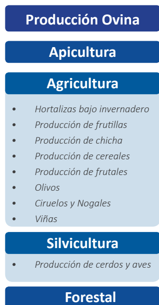
Ilustración 5 Elaboración propia en base a PLADECO 2016-2019.

Entre las principales actividades económicas de la comuna se pueden destacar las que tienen relación con el ámbito agropecuario, siendo este último el principal polo de desarrollo que ha tenido. Los rubros destacados de acuerdo al actual PLADECO 2016-2019 son los siguientes: