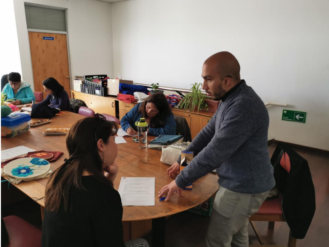
Taller diagnóstico con la comunidad del sector rural de Carrizal Bajo