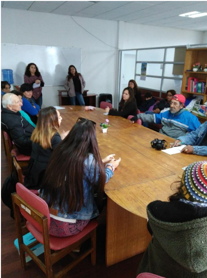
Taller diagnóstico con equipo municipal