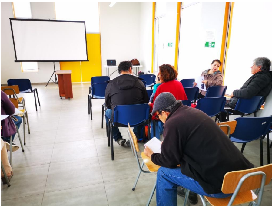
Taller diagnóstico con mesa de artesanos