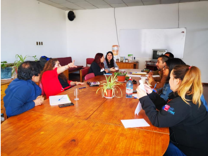
Taller diagnóstico con la comunidad