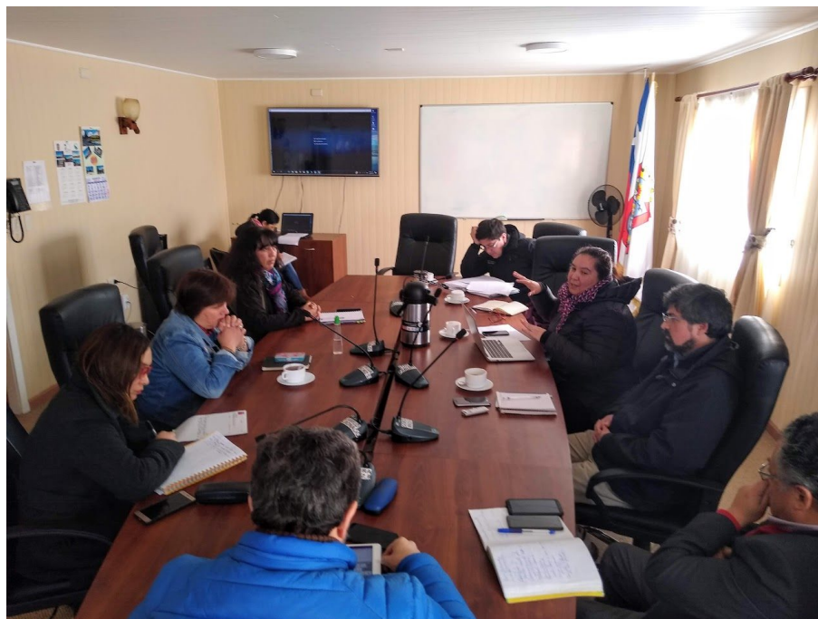
Reunión de Mesa Técnica PMC Curaco de Vélez, 13 agosto de 2019.

De acuerdo con las orientaciones del Ministerio de las Culturas, las Artes y el Patrimonio, en la construcción de un PMC se identifican los siguientes elementos: