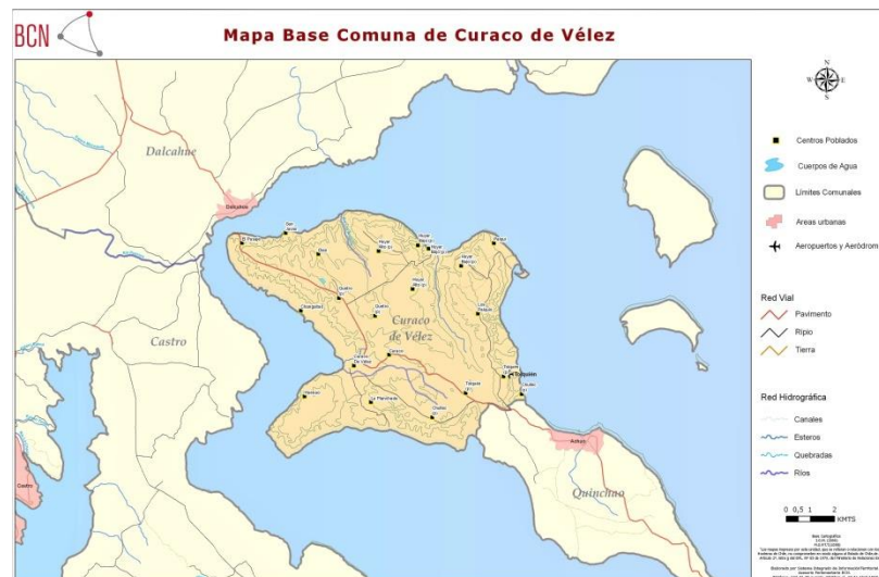
Mapa de la comuna y sus localidades.

Otros aspectos destacables son los paisajes y la biodiversidad que conserva esta comuna, tal como las expresiones de su arquitectura urbana y rural, la forma de vida y las costumbres de la gente, que han sido registrados por viajeros, fotógrafos, canales de televisión, escritores, investigadores y científicos, difundiendo su belleza y la importancia de preservarlos para las generaciones venideras.