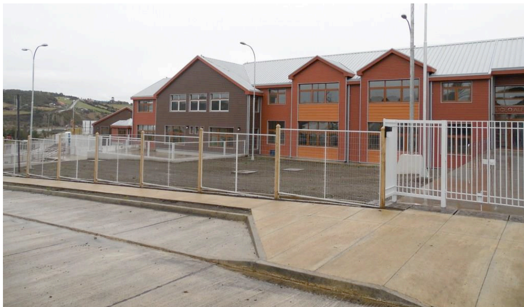
Nuevo edificio del Liceo Alfredo Barría Oyarzún.