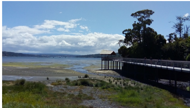
Desembocadura del río Vélez en el canal Dalcahue.