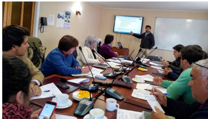
Exposición del PMC ante el Concejo Municipal de Curaco de Vélez, 13 agosto 2019.

El diagnóstico participativo consiste en un proceso en que la comunidad entrega su parecer respecto a sus recursos y necesidades culturales, la programación y demanda cultural, así como propuestas para su implementación.