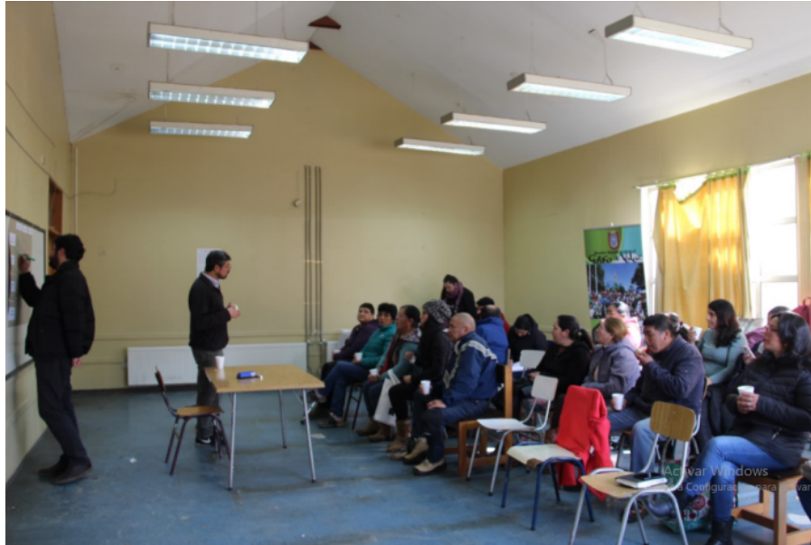
Matriz diagnóstico participativo Curaco de Vélez