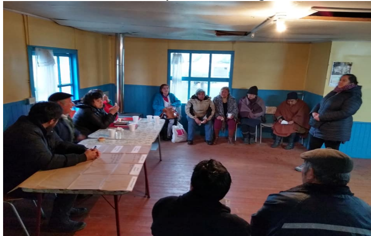
Asamblea PMC en Los Palquis, martes 27 agosto, 13:30 horas