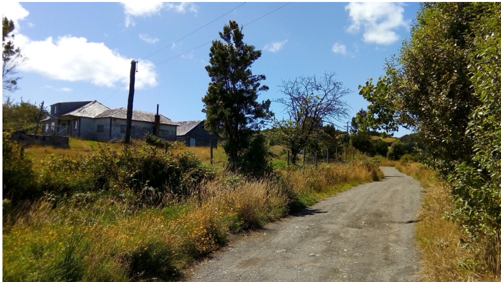
Casa de Curaco de Vélez, donde se grabó la película “Y de pronto... el amanecer”.

Trabajar en gestión de artes escénicas o visuales, en gestión del patrimonio, en gestión cultural municipal o en centros culturales, sin duda que necesita de diferentes competencias y habilidades que son fundamentales de observar y generar. Así, la gestión cultural avanza en el desarrollo de sus prácticas y se especializa. Lo importante es construir los espacios y herramientas necesarias para que esto ocurra, y desarrollar modelos que aborden las características y especificidades necesarias del medio local.