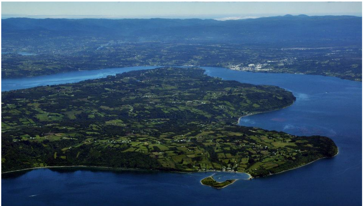
Fotografía aérea desde Palqui hacia el canal Dalcahue (Christian Brown).

Actualmente la comuna se distingue en el archipiélago por sus antiguos poblados rurales (aldeas costeras y de interior), su arquitectura (iglesias, casas, galpones, molinos y diversas construcciones en madera), la religiosidad, el folclor, la cocina tradicional, la artesanía local (principalmente tejidos y cestería), los cultivos marinos y las costumbres de su gente.