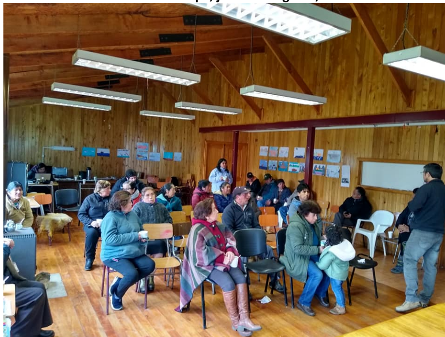
Asamblea PMC en Palqui, jueves 29 agosto, 10:00 horas