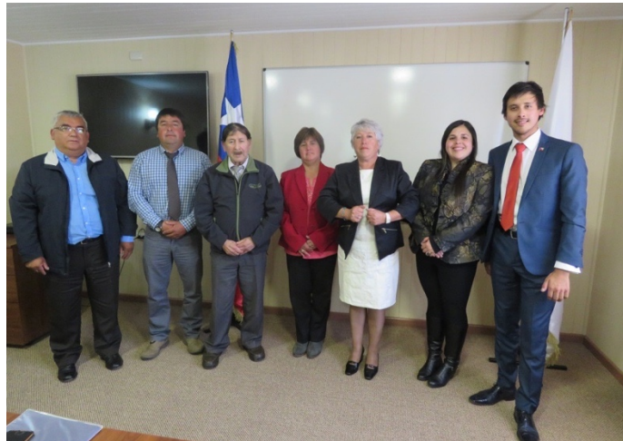
Alcalde y Concejo Municipal, período 2016 – 2020.