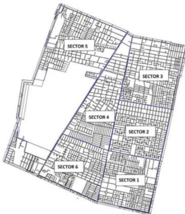
Imagen: Plano comuna de El Bosque, sectorizado