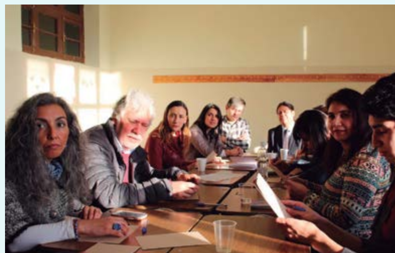
Región de Magallanes