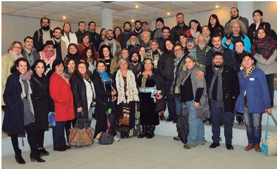
Arriba: Convención de Cultura región Metropolitana en el Centro Cultural Estación Mapocho.