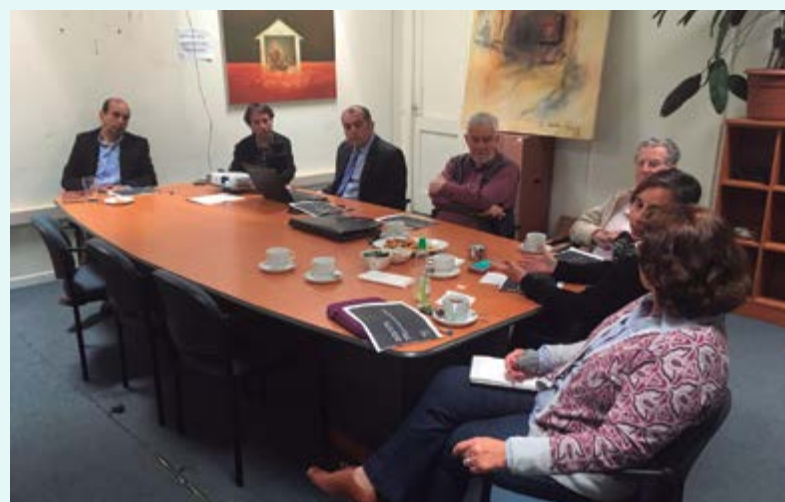
Región de O'Higgins