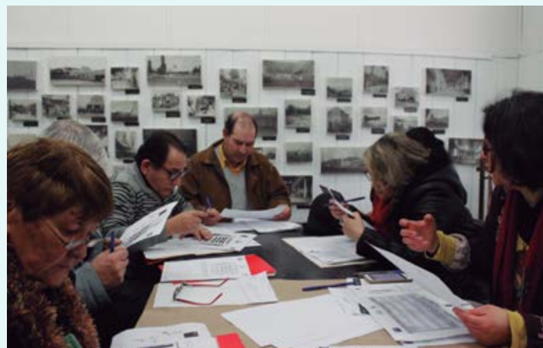
Región de Los Ríos

Por su parte, el enfoque de territorio vela por recoger las particularidades de cada lugar: la diversidad de necesidades y formas de abordar las brechas identificadas y objetivos propuestos para el desarrollo cultural. Uno de los principales fines de este enfoque es contar con una ciudadanía que influya y proponga activamente líneas de trabajo para las acciones públicas.