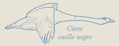
Cisne cuello negro

* Créditos : Institución responsable: Secretaría Regional Ministerial de las Culturas, las Artes y el Patrimonio Región del Libertador General Bernardo O'Higgins