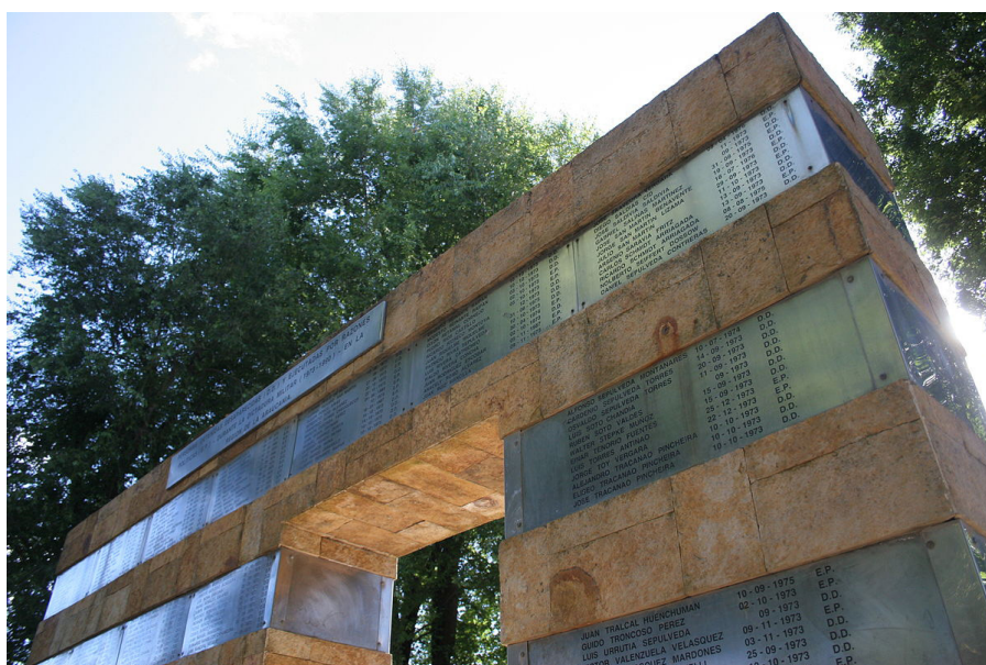
Memorial DD.HH. - Temuco

Desde octubre del 2019 en adelante, hemos visto cómo las violaciones a los Derechos Humanos cometidos por las fuerzas armadas y del orden nos llevan de vuelta a un pasado que anhelábamos no repetir. Sin embargo, parte importante de la ciudadanía ha vuelto a ser víctima de la acción represiva de agentes del Estado, bajo el argumento de