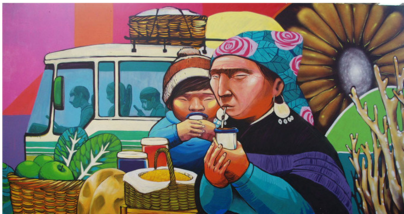
Mural realizado por Colectivo A la Pinta - Ubicación: Feria Pinto, Temuco.

ka mülelu ti weza kutxan Covid-19 pigelu tüfa yetufi ta OCC ka küzaw yenetual pepi txawüwenolu pu che chemu rume kam chem zugu mew rume feymew virtual küzawkületuy fillke che ka femechi mew ti OCC müley tañi virtual küzawal tüfachi weza zugu mülelu am. Kagechiletulu am mogen ka femechi felekatulu ta pu che, fentxen OCC’s küzawküley müten tañi pepi kelluafel ta pu che tañi chumlen mew País mew, chuchi OCC’s rume wekuntu kunuwülayafuy famechi zugu mew ka ñi chumletun ti politika fütxa txipal zugu mew ti mari pura konchi octubre küyen mew rupalu, femechi mew pegey fentxen wezake zugu mew mülelu ti kagechilen ti mogen mew fillke che mu. Feymew rakizuamküleygün ta tüfachi kalewetun mogen ñi zoy kümelkaletuafel femechi mew müley tañi kom feypigeal ti wezake zugu ka kümelkakunugetual, ka ti pu che entulu ti fillke txekañman ka kewan zugu zugu tañi allkütugeal ñi fillke wezake mogen yenelu fillazmew müley tañi kellugeal ti entugeafel kümeke zugu ka goymagenoal ñi kewan feymew wüla pu che pepi zuguy ti wezake zugu mew. Kom pu che yamüwkefuy welu goymalayafuiñ ti fillke che nürüftukugelu ka chügarkagelu ka lagümkagelu feypimum ñi mupin wezake zugu fillazgenmu am. Fachantü inalayafuiñ ti re democracia pigelu müley tañi wüne küzawgeal ti rüf zugu ka norüm zugu taiñ mületuafel ti estaw plurinacional pigelu.