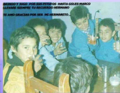
BRINDO Y JUGO POR SUS PITUFOS HASTA GOLES MARCO LLEVARE SIEMPRE TU RECUERDO HERMANO TE AMO GRACIAS POR SER MI HERMANITO...