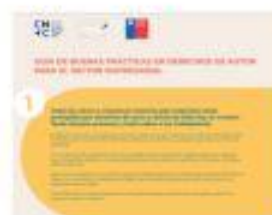
Guía de buenas prácticas en derechos de autor para el sector empresarial - extensión