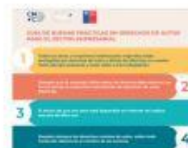
Guía de buenas prácticas en derechos de autor para el sector empresarial - resumen