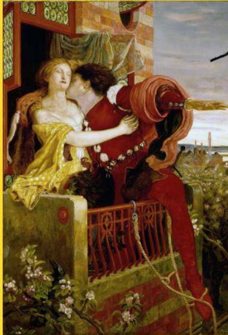
Ford Madox Brown